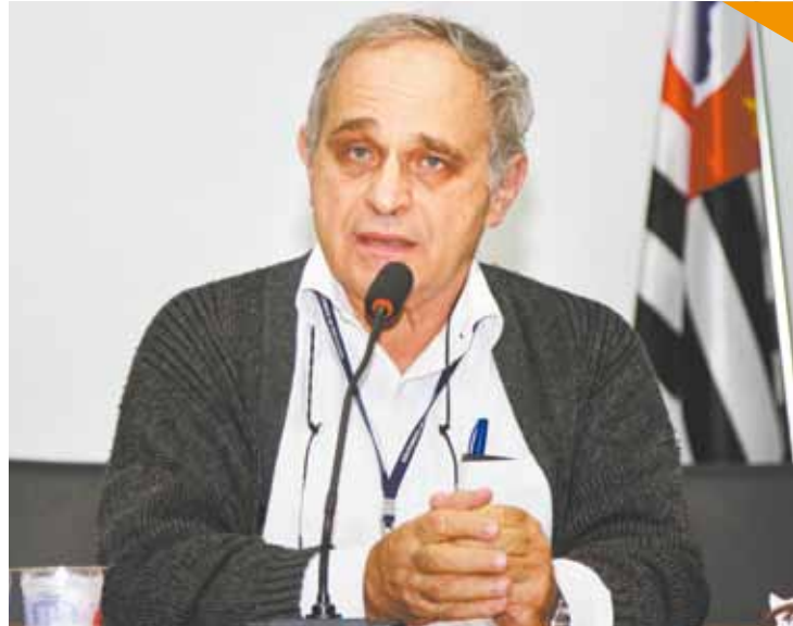
Realista - Por ora, Derman não vê possibilidade de Hospital no São João