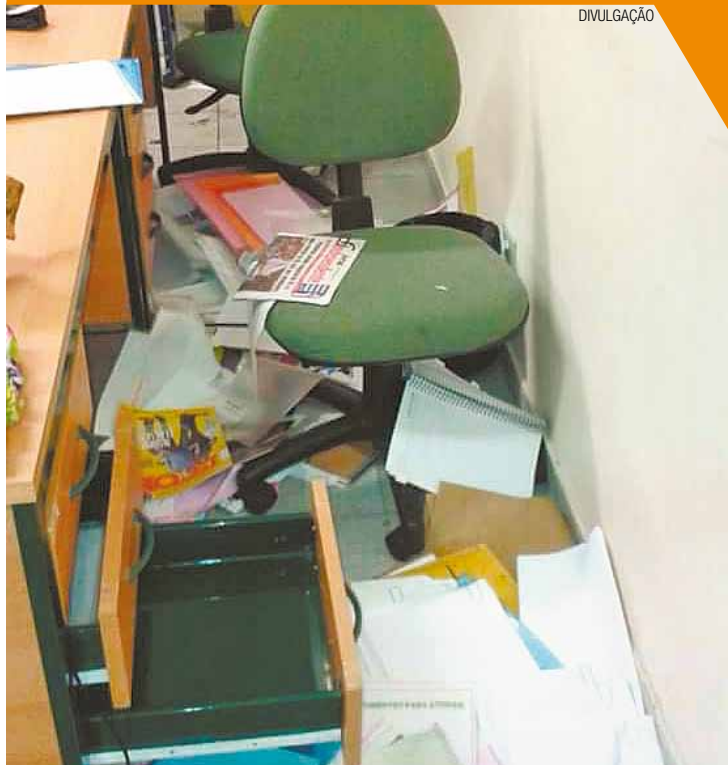
Quebra-quebra - Escola do Jardim Jovaiia foi atacada por vândalos