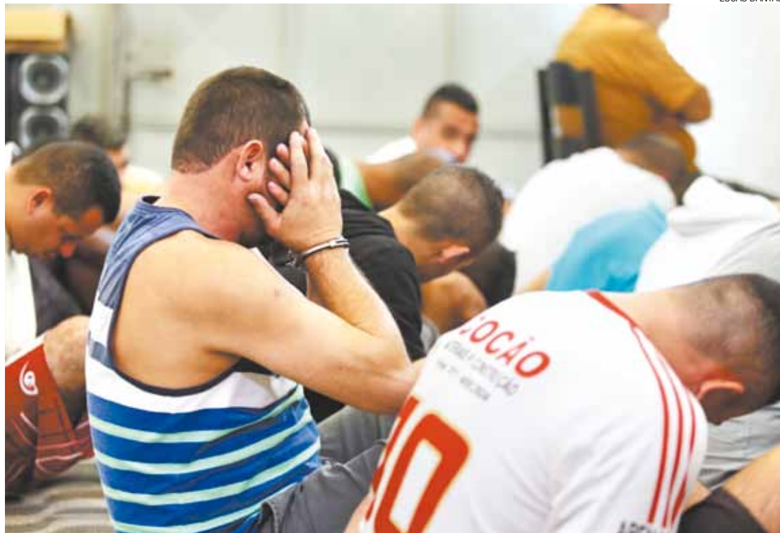
Em cana - Presos, algemados, escondiam o rosto no pátio do 5º DP; entre eles havia um menor de idade