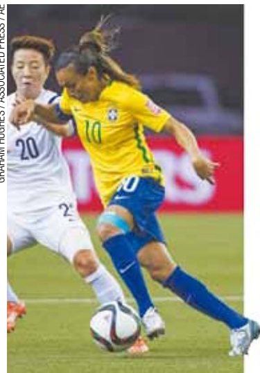
Craque - A camisa 10 Marta avança sobre a marcação coreana

O Brasil abriu o placar aos 33min do primeiro tempo: Cristiane tentou a jogada individual, a defesa cortou muito mal e tocou a bola nos pés de Formiga, que