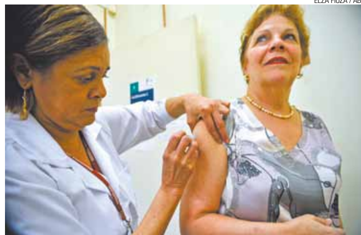
Importante - Vacina protege contra três subtipos de vírus da gripe

Quase 34 milhões foram vacinados no País em campanha