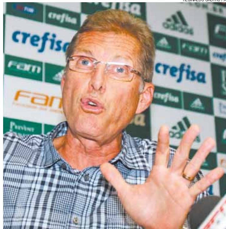
Coletiva - Após a dispensa, treinador criticou cartolas do Palmeiras

Após a dispensa, treinador criticou cartolas do Palmeiras