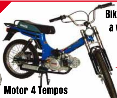
Motor 4 Tempos