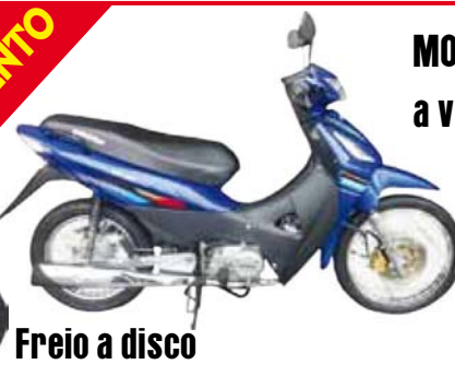
Freio a disco