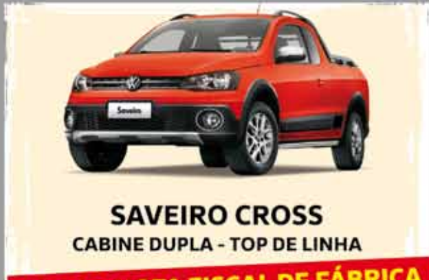
SAVEIRO CROSS CABINE DUPLA - TOP DE LINHA