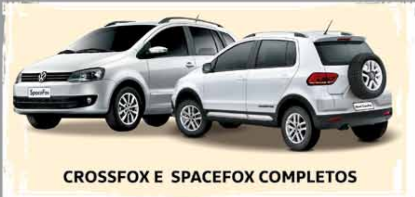
CROSSFOX E SPACEFOX COMPLETOS

OUTRAS OPORTUNIDADES NO ESTOQUE Venha conhecer o novo Fox Rock in Rio