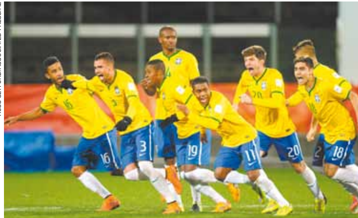
Vibração - Brasileiros converteram as cinco cobranças de pênaltis

Vitória mantém o Brasil na luta para igualar-se à Argentina