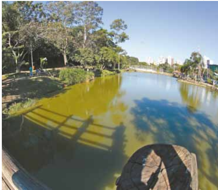
Passeio - Haverá três roteiros com saída e chegada no Boque Maia

RÔMULO MAGALHÃES - Maior parque urbano de Guarulhos, o Bosque Maia será um dos atrativos do novo formato do Roda SP, programa do governo que visa promover o turismo no Estado. De cara nova, os roteiros desta edição estão em formatos de city tour, com acompanhamento de guia em todo o percurso. São 14 roteiros, por apenas R$ 10, cada. No município, há três opções de passeio. O Roda SP 2015 começa hoje e termina no dia 28 de junho.