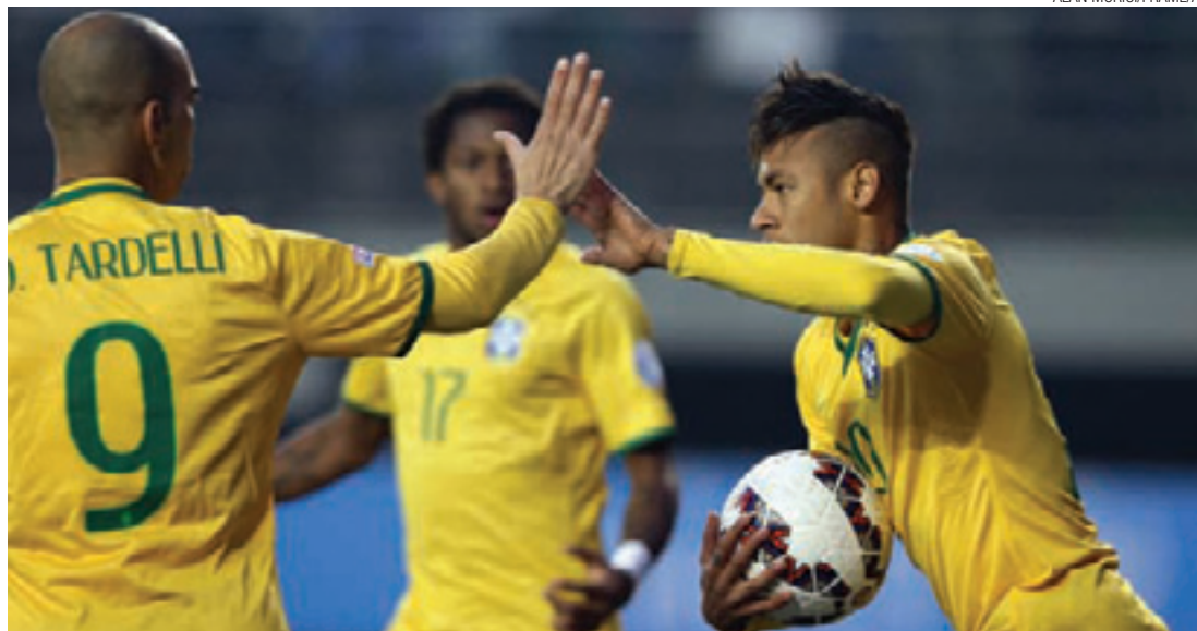
Goleador - Neymar marcou o gol de empate do Brasil contra o Peru. Foi o 45º tento dele pela Seleção

Vinho Tinto venceu uma das favoritas ao título do torneio