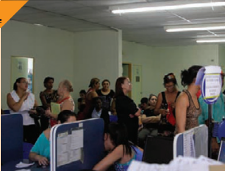
Região Taboão - Pacientes da UBS Jovaia já ficaram duas horas esperando

Segundo a Secretaria de Saúde, para aprimorar e qualificar o atendimento a Prefeitura inaugurou uma Unidade de Pronto Atendimento (UPA São João) e está prestes a entregar outras duas: no Jardim Cumbica e no Jardim Paulista, aumentando a oferta de serviços de urgências. "Ao mesmo tempo a Pasta está investindo na melhoria da Atenção Básica para que as pessoas façam a prevenção, evitando a doença e diminuindo a demanda nos serviços de urgência", diz nota.