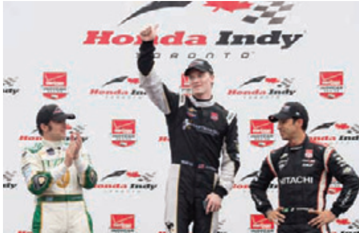
Pódio - Castroneves (dir.) olha para a comemoração de Newgarden

A dobradinha só aconteceu porque Newgarden contou com a sorte. Depois de largar na 11ª colocação, ele foi para os boxes na 28ª volta, quando aconteceu a primeira bandeira amarela e conseguiu voltar no pelotão da