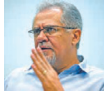
Recusa - Almeida disse que não ocorreu atraso nos pagamentos

gestão B para A, por exemplo, ela não promoveu os trabalhadores C para B. “A sentença deve passar agora à fase de execução, após retorno à primeira instância, onde a ação começou”, explicou o advogado. O concurso de acesso foi realizado em 2007, mas o processo foi movido pelo Stap um ano depois, em 2008.