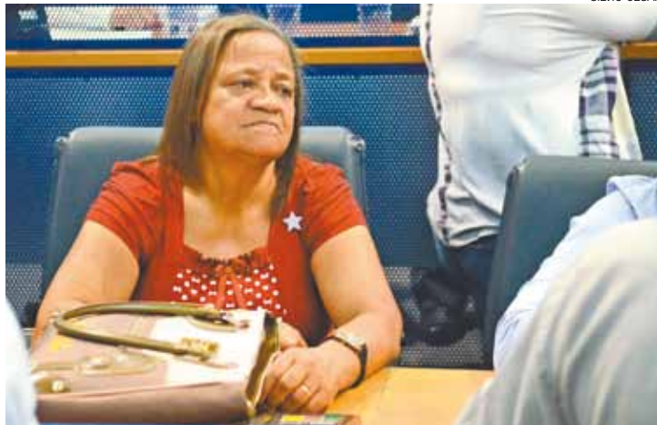
Fiel - Política ficou indignada com provocações aos cristãos na parada de SP