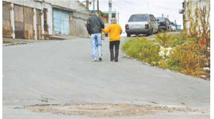
Colisão - Na Rua Passagem, o buraco causou acidente entre dois carros

Moradores esperam seis meses por reparos