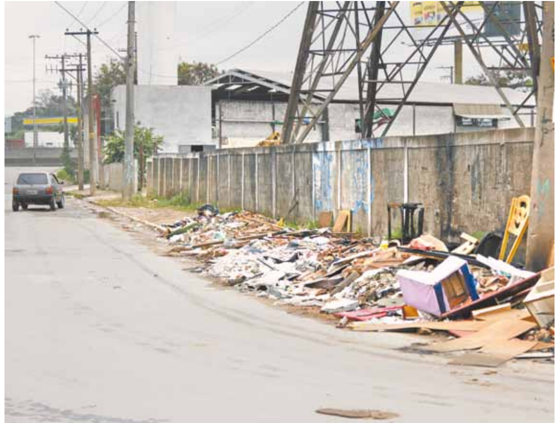
Mau hábito - Lixo e entulho são despejados por veículos a qualquer hora do dia, reclamam vizinhos

Em nota, a Progresso e Desenvolvimento de Guarulhos (Proguaru) informou que “a retirada do material disposto irregularmente será realizada até o final da próxima semana”. A empresa orienta os moradores a colaborar com a conservação da limpeza fazendo o descarte de entulho em um dos Pontos de Entrega Voluntária (PEVs). Os endereços podem ser consultados no site: www.guarulhos.sp.gov.br