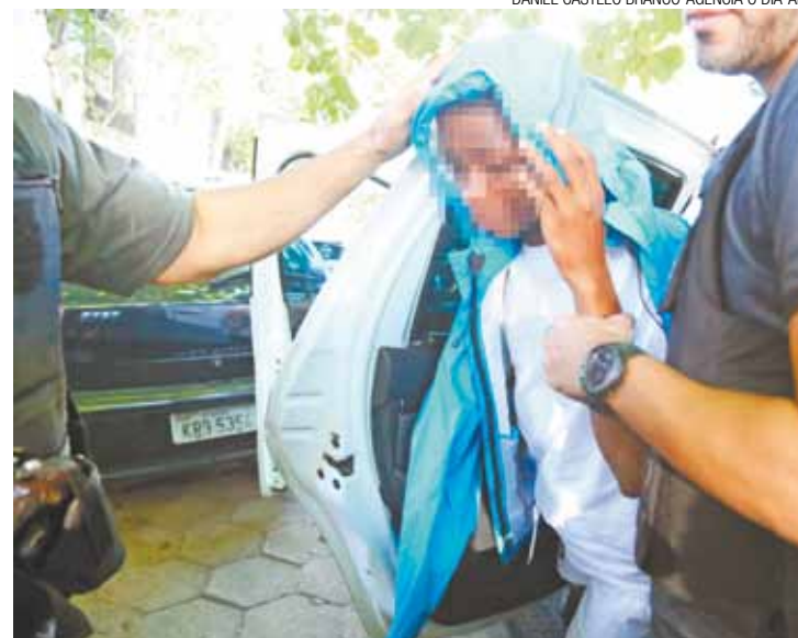
Rio - Menor apreendido por morte de ciclista na Lagoa Rodrigo de Freitas

Av. Dr. Timoteo Pentead, 3958 – Vila Galvão - Guarulhos/SP