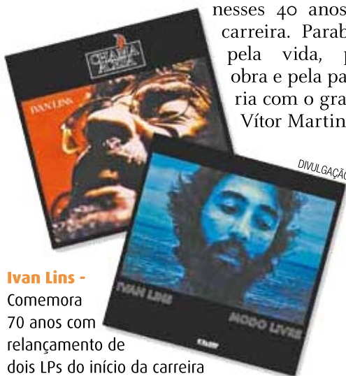
Ivan Lins - Comemora 70 anos com relançamento de dois LPs do início da carreira

A partir da segunda metade dos anos 1980, o cantor começa a enfatizar a carreira internacional, principalmente nos EUA, tornando-se um dos artistas nacionais mais gravados fora do País. Quincy Jones, George Benson, Ella Fitzgerald, Sarah Vaughan, Barbra Streisand e Sting foram alguns dos nomes expoentes que gravaram suas canções. Vale conhecer os dois CDs desse grande artista que nos orgulha, e que manteve sua música intacta às corrosões de tantos modismos nesses 40 anos de carreira. Parabéns pela vida, pela obra e pela parceria com o grande Vítor Martins!