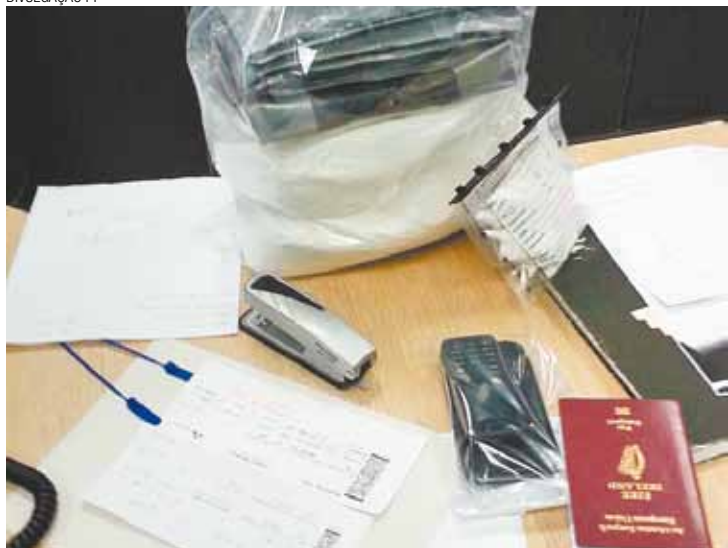
Crimes - Irlandesa portava cocaína; casal chinês usava documentos falsos