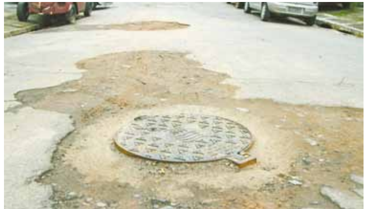
Recorrente - Consertos e reparos são comuns na Rua Felipe Guerra