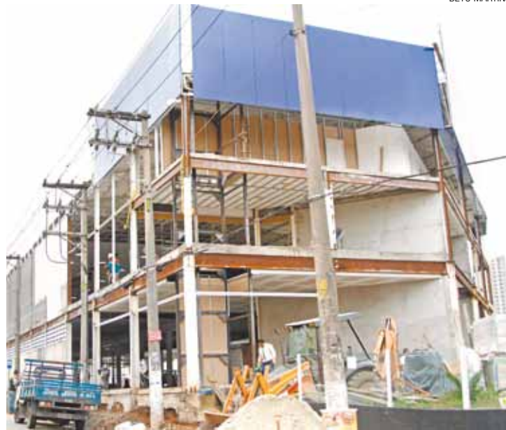
Embargada - Trabalhos de igreja desrespeitam determinação da SDU

Prefeitura notificou, multou e embargou construção