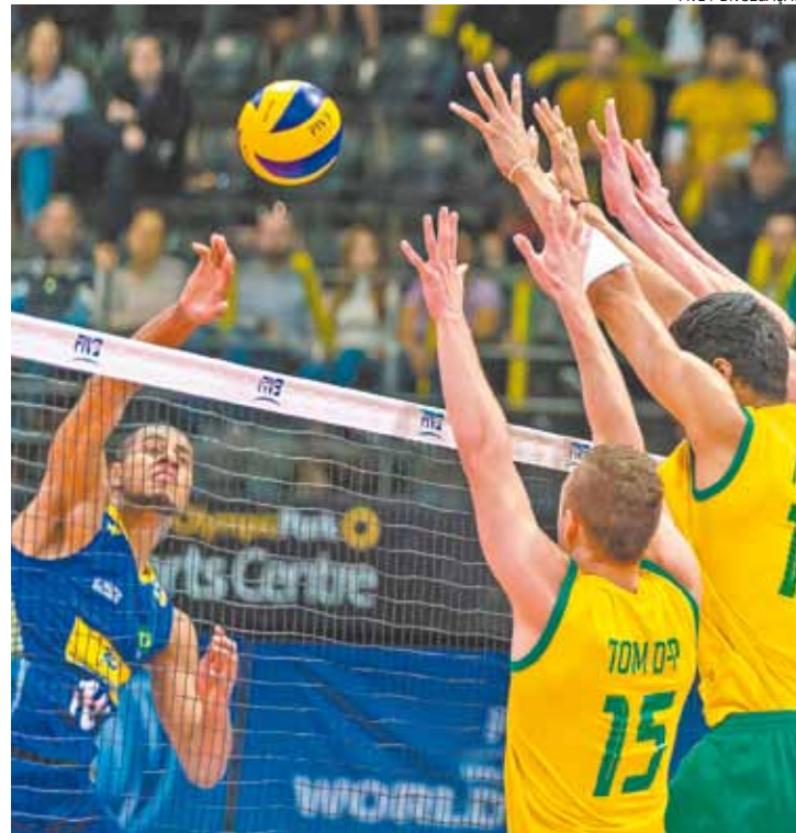
No azul - Viagem pelo Mundial teve saldo positivo à equipe brasileira

“Assim como no jogo de ontem (sábado), conseguimos fazer uma pressão de saque neles, nosso bloqueio funcionou mais uma vez e conseguimos anular um pouco o principal jogador deles”, disse Lucarelli, que foi o destaque na partida.