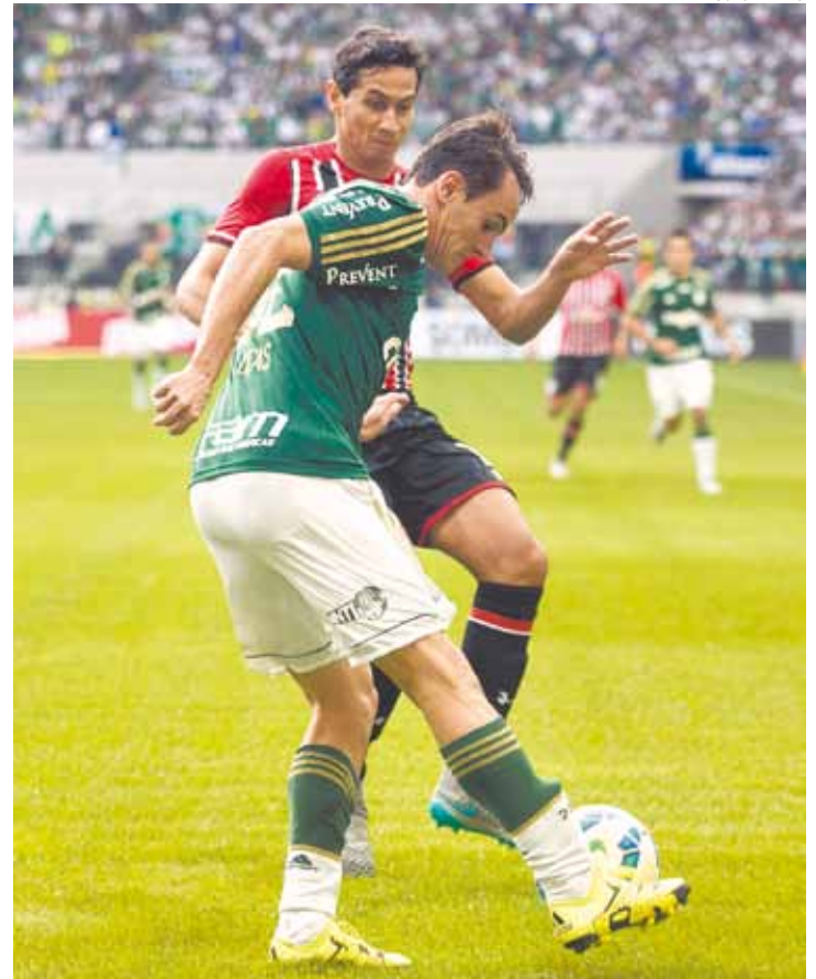
A pau - Defesa palmeirense matou os lances dos jogadores do Tricolor