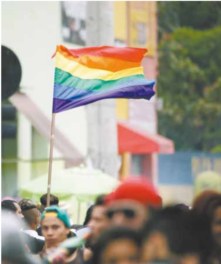
Direitos - Bandeira LGBT se destaca na Parada Gay local, em 2013