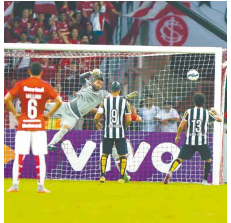
Esse joga - Valdivia, do Colorado, pôs a bola na gaveta do gol do Peixe