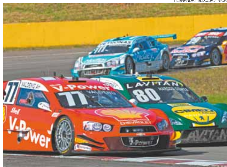
Perseguição - Pilotos correm para passar Cacá Bueno, líder com 113 pontos

Júlio Campos que antes das etapas era o líder da competição não teve um bom domingo. O piloto abandonou a primeira bateria logo nas primeiras voltas e, na segunda, rodou na pista e acabou o dia na 16ª posição.