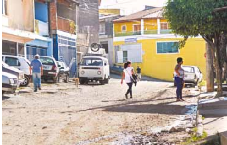
Descaso - Prefeitura não tem previsão para pavimentar vias públicas

Entre as tentativas de conseguir asfalto estão requisições à Prefeitura e até abaixo-assinado. Até houve uma tentativa de concretar as vias com pedras e cimento, mas os materiais se soltaram e deixaram as ruas desniveladas. A poeira incomoda, assim como a lama nos dias de chuva.