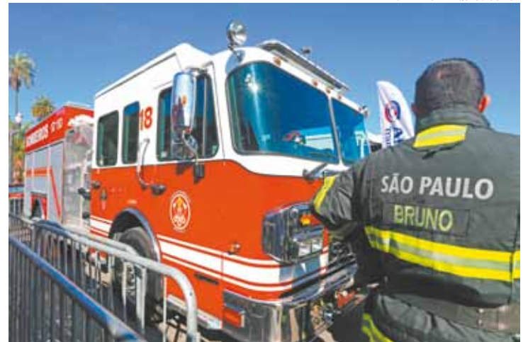
Novas viaturas - Mais modernos, veículos ajudaram nos trabalhos do 5ºGB

O secretário da Segurança Pública, Alexandre de Moraes, esteve junto com o governador Geraldo Alckmin na entrega de equipamentos e medalhas.