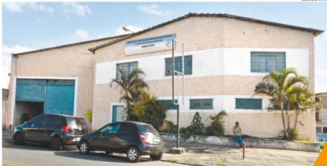
Segurança - Delegacia instaurou 64 inquéritos e prendeu 11 suspeitos de janeiro e maio deste ano

O delegado seccional acrescentou que a situação do 3º DP ainda está em "fase judicial". "O fechamento depende da Justiça".