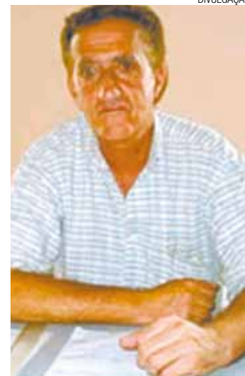
Fisguela - Anota por ano 5,2 mil partidas da liga de futebol amador

Neste mês, a entidade recebeu certificado de filiação da Federação Paulista de Futsal (FPFS).