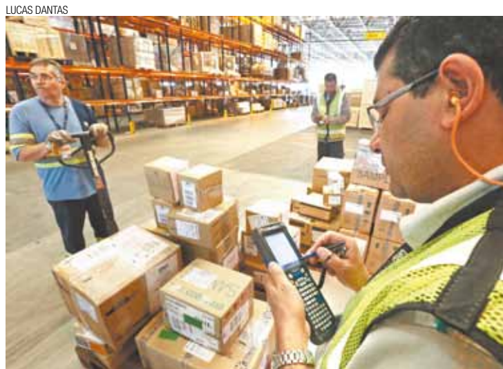
Crescimento - Volume de cargas subiu por causa de 4 voos cargueiros

Gru Airport Cargo exportou mais de 117 toneladas em 2014, crescimento de 9% em relação ao ano anterior