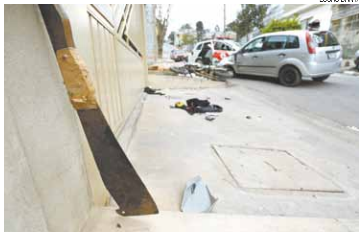
Raiva - Homem atacou Silva com um facão, após derrubá-lo de moto

Comerciante golpeou bandido para se defender