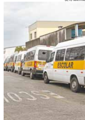
Paradas - Vans escolares ficam estacionadas perto da Prefeitura

Presidente da Associação dos Condutores Escolares Particular e Gratuito de Gua-