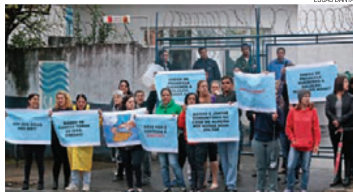
Revolta - Manifestantes levaram cartazes com frases contra o Saae

A partir do dia 7, o bairro terá água dia sim, dia não