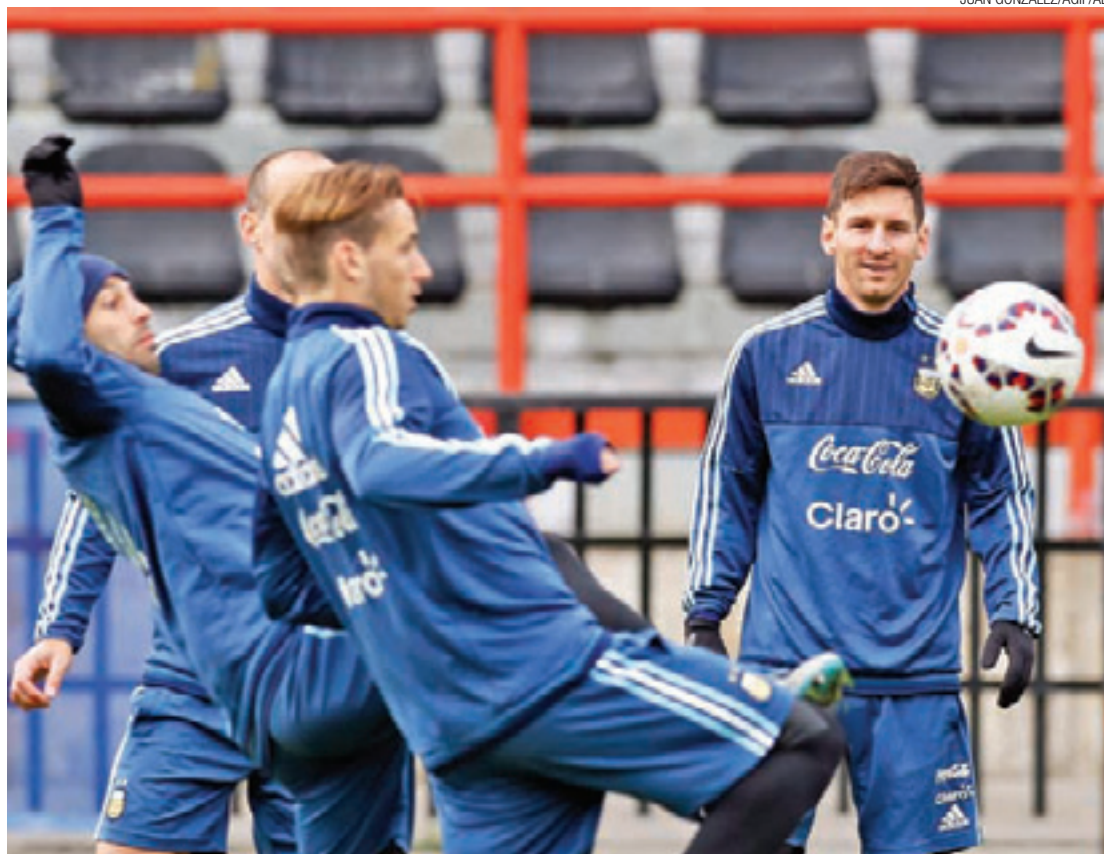
Ansioso - Messi olha brincadeira de jogadores da Argentina na véspera da final. Craque ainda busca 1º título

Chile e Argentina lutam para escapar do jejum