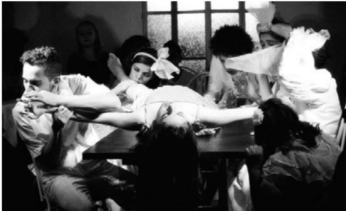
Criatividade - “P(ratos) do Dia” é um dos espetáculos já desenvolvidos pela Escola Viva de Artes Cênicas