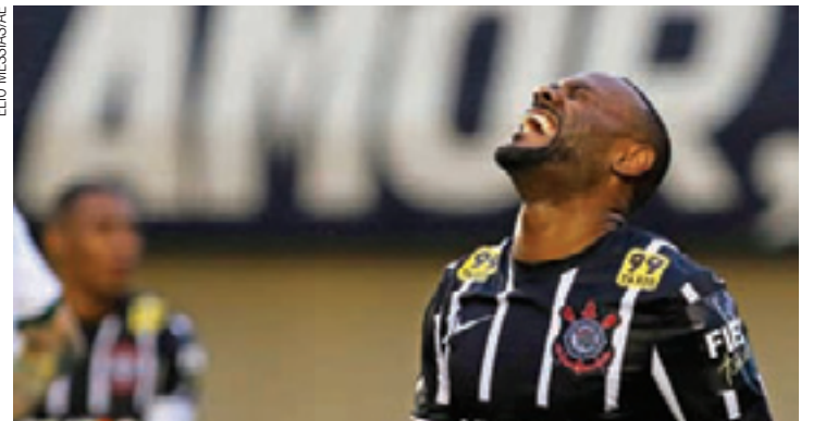
Sina - Vagner Love segue sem balançar as redes em jogos fora de casa