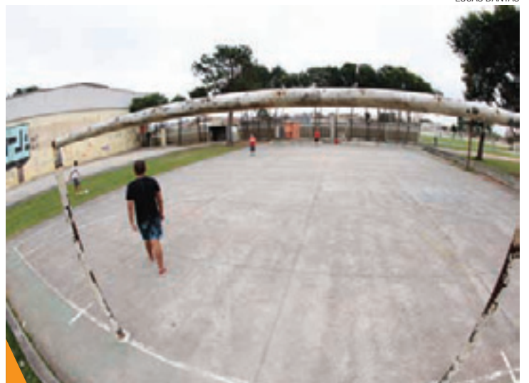
Abandono - Hoje, Estádio é tremenda saudade da população

“O gramado está conservado porque é utilizado pelo pessoal do Rugby. Fora isso, mais nada”, disse ele.