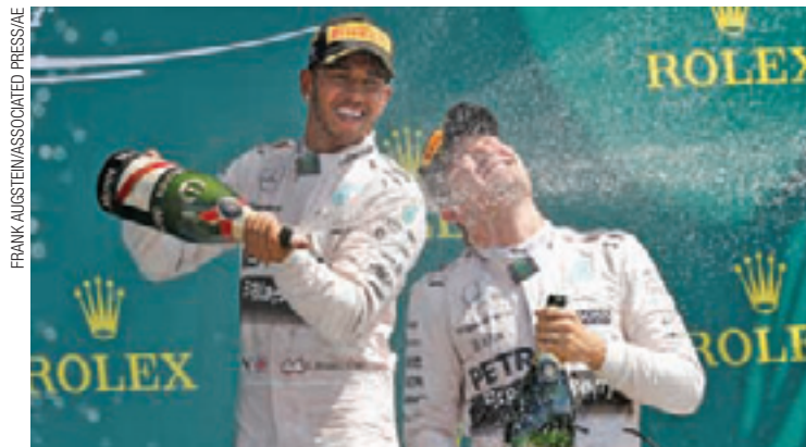
Dobradinha - Hamilton (esq.) comemorou a vitória com Rosberg (dir.)

Após as paradas, Williams e Mercedes avisaram que seguiriam sem trocas de pneus até o fim. A próxima etapa da temporada será disputada no dia 26 de julho, na Hungria.