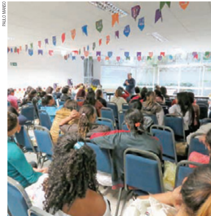
Caridade - Encontro teve dicas para 120 gestantes no Colégio Carbonell

No sábado, as 120 gestantes inscritas receberam orientações importantes sobre as fases da gravidez (com a ginecologista Viviam Valdemarca), a importância da alimentação