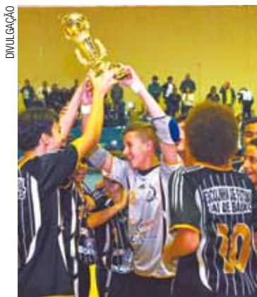
Sub 14 - Equipe venceu Parque Cecap na final do Municipal

Em uma das partidas mais esperadas da rodada, a final da categoria Sub-12 foi feita pela equipe A contra a B do Sai de Baixo. O time A, comandado pelo técnico Wandylton, venceu os atletas do técnico Thiago por 4 a 1.