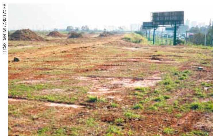
Klabin - Legislativo tentou tornar terreno área de proteção ambiental