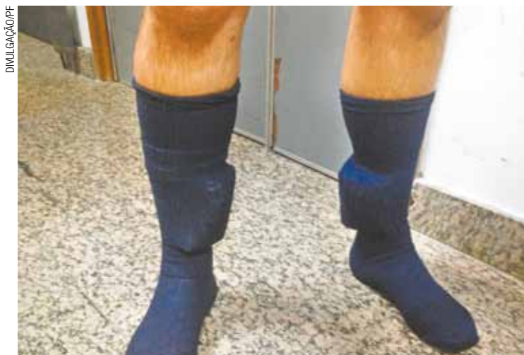
Flagrante - Brasileiro chegou a Guarulhos em voo proveniente dos EUA

“Ao passar pelos canais de inspeção, os fiscais perceberam que ele ocultava algo