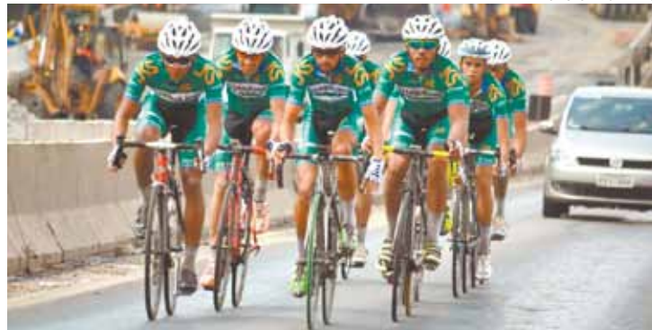
Força Máxima - Facex convocou os 7 atletas da equipe para a disputa

RÔMULO MAGALHÃES - A Pro Cycling Team ADF participa de mais uma importante prova do calendário brasileiro de ciclismo. A equipe de Guarulhos corre na próxima quinta-feira, 9, feriado paulista da Revolução Constitucionalista de 1932, a 69ª Prova Ciclística 9 de Julho, que depois de quatro anos volta a ser disputada nas ruas de São Paulo.