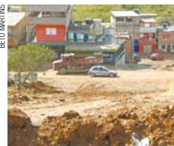
Ruas de terra - Implantação de galerias continua inacabada

Moradores têm dificuldade de andar pelas ruas