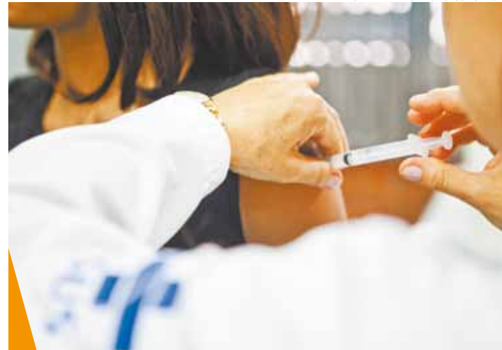
Vacinação - É a melhor forma de se prevenir contra o HPV

Em uma outra pesquisa, comandada por Kowalski, os médicos detectaram que 32% dos casos de câncer de boca em jovens adultos eram portadores do vírus. Em pacientes acima de 50 anos, a presença do vírus foi detectada em apenas 8%.