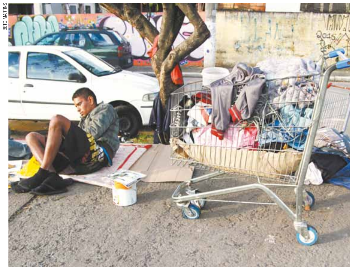
Agasalhos - Doações de roupas pela igreja auxiliam os moradores de rua que não utilizam os albergues municipais

Inverno aumentou a frequência no uso de albergues