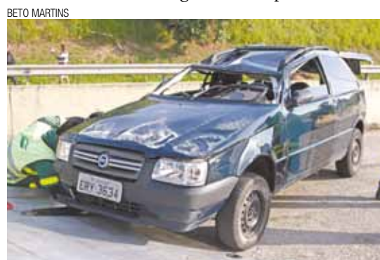
Capotamento - Fiat ficou com a lataria ralada e teto amassado

Após o acidente, o carro foi levado para a base da Eco-pista, no km 28.