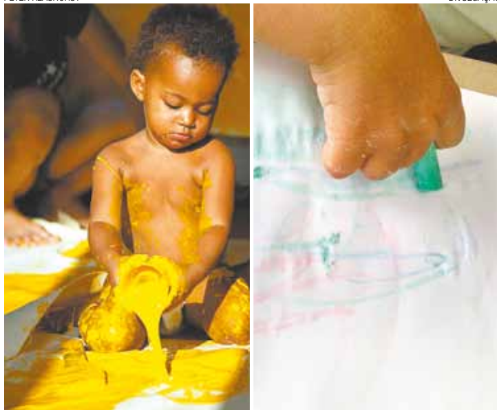
Diversão - Tinta para colorir, com direito a pintura com giz molhado

Atividades são direcionadas para a criançada