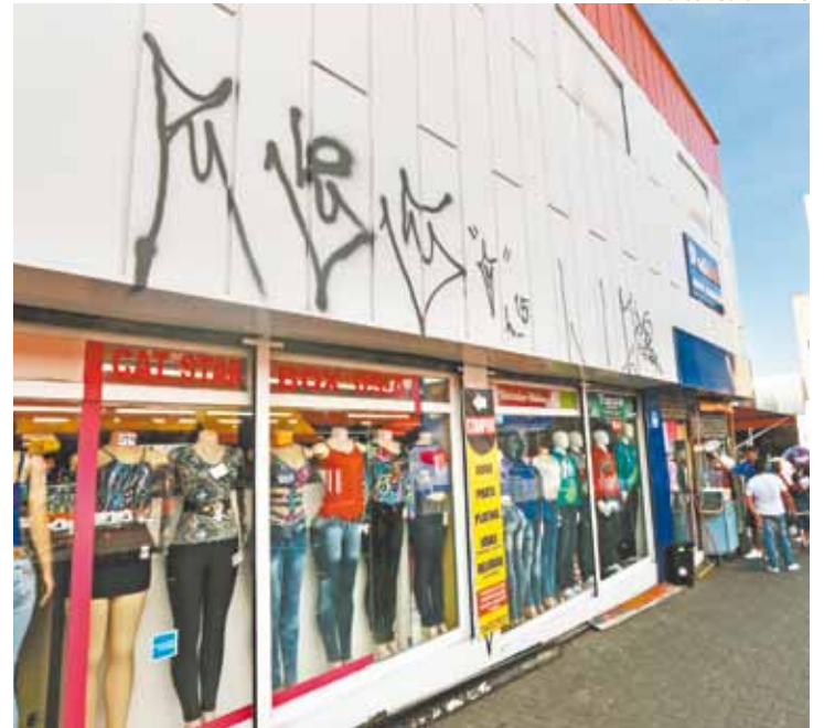
Rotina - Lojas abriram com as fachadas sujas pela ação dos vândalos

A Secretaria de Cultura e a Guarda Civil Municipal não se manifestaram sobre o assunto até a conclusão desta reportagem.