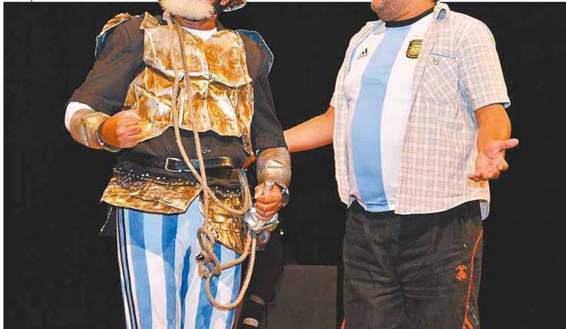
Adamastor - Com entrada franca, espectadores devem retirar ingressos com uma hora de antecedência