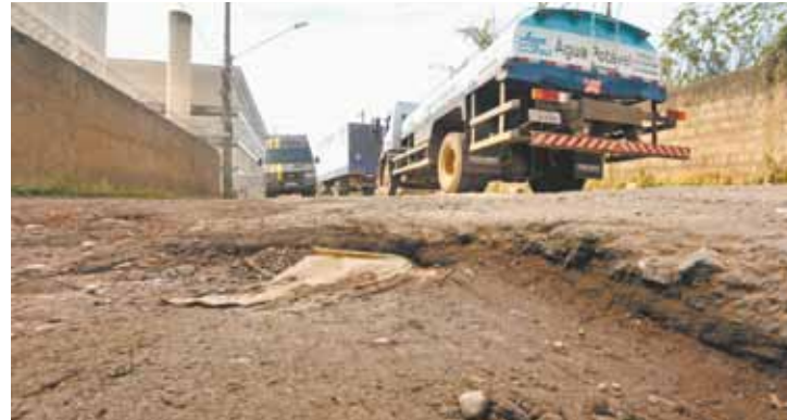
Crateras - Veículos têm dificuldade para passar pelos obstáculos