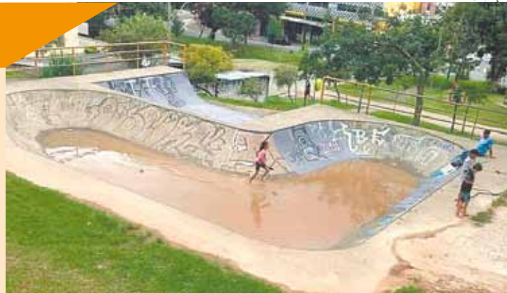
Alagada - Única bowl de Guarulhos virou, literalmente, uma piscina

Em 2013, a Prefeitura respondeu à Folha Metropolitana que os locais citados pela reportagem (Pistas do Jardim City, Jardim Adriana e Jardim São Paulo) estavam na programação do Departamento de Parques e Praças para vistoria nos lugares. Informou também que "se fossem constatados problemas, haveria intervenções". Nada foi feito. Questionada nesse ano, o governo não respondeu às questões da reportagem, como previsão de reformas, manutenções, ou pelo menos, se havia realizado visita nos locais. A Secretaria de Esportes se limitou a responder que "as intervenções nas pistas de skate são realizadas de acordo com as solicitações recebidas e que novas intervenções dependem de aprovação orçamentária ainda em análise".