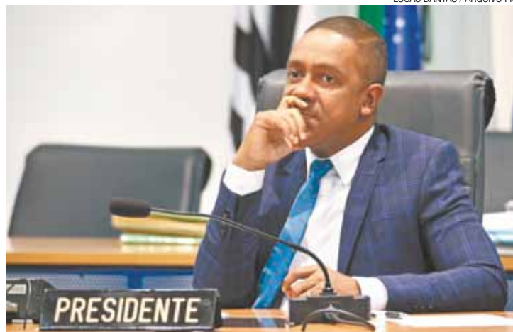
Problemas - Sobrou para Jesus reestruturar a Câmara como manda a lei

Desde junho, o procurador move uma Ação Direta de Inconstitucionalidade (Adin) contra a lei 7.321 de 2014, que criou uma série de manobras para permitir comissionados em cargos destinados a concursos en-