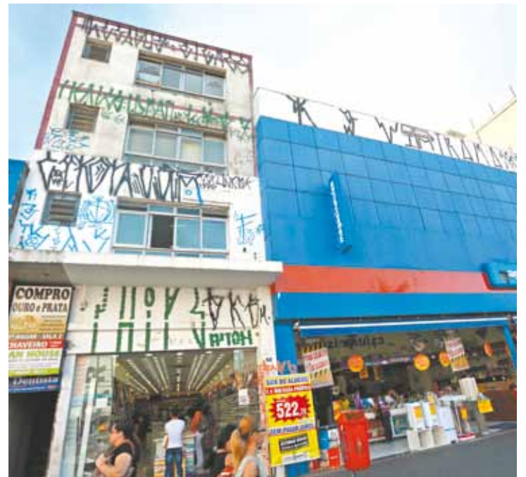
'Acrobatas' - Suspeitos 'preencheram' prédio de 3 andares com tinta