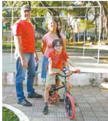
Adorou - Yohanan saiu do parque querendo voltar no dia seguinte