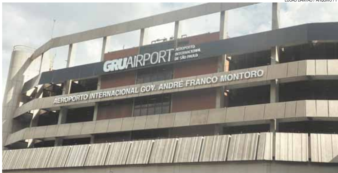
Avanço - Investimentos da OAS resultaram na modernização dos terminais 1 e 2 do aeroporto de Guarulhos

OAS tem 25% dos ativos da Invepar, que detém 90% do consórcio do aeroporto local