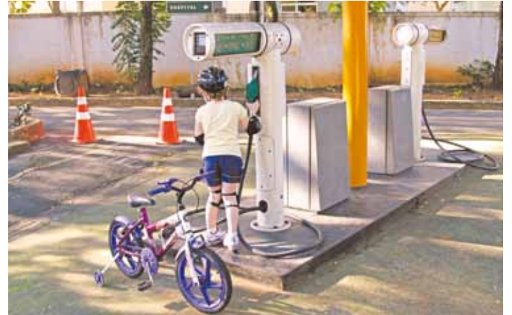
Cidadezinha - Crianças simulam trânsito, inclusive "abastecendo" as bikes