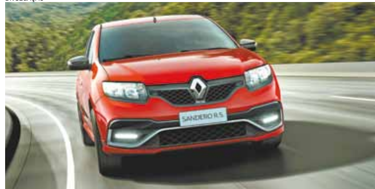
Hot hatch - Veículo inaugura um subsegmento genuinamente esportivo