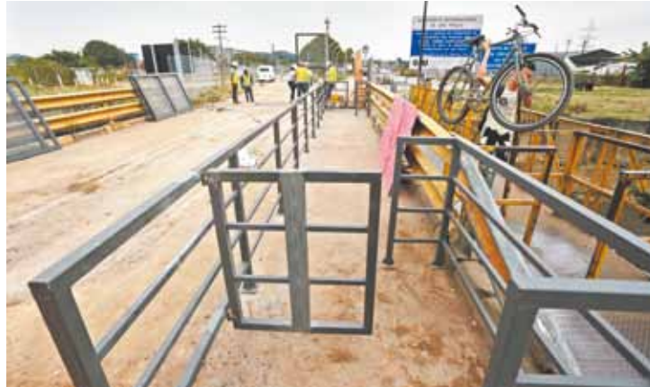
Semiaberta - Um portão de acesso foi instalado no local