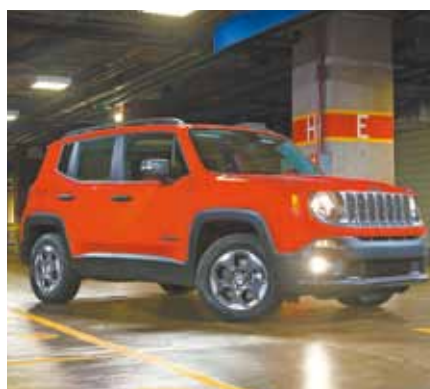
Cinco estrelas - Produzido em Pernambuco, é o primeiro a receber classificação máxima