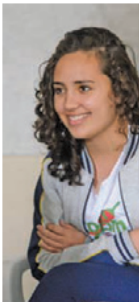
Aluna - Victoria quer fazer Faculdade de Jornalismo