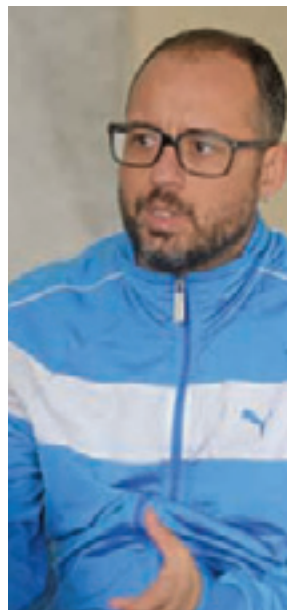
Coordenação - “Projeto é importante para a região”