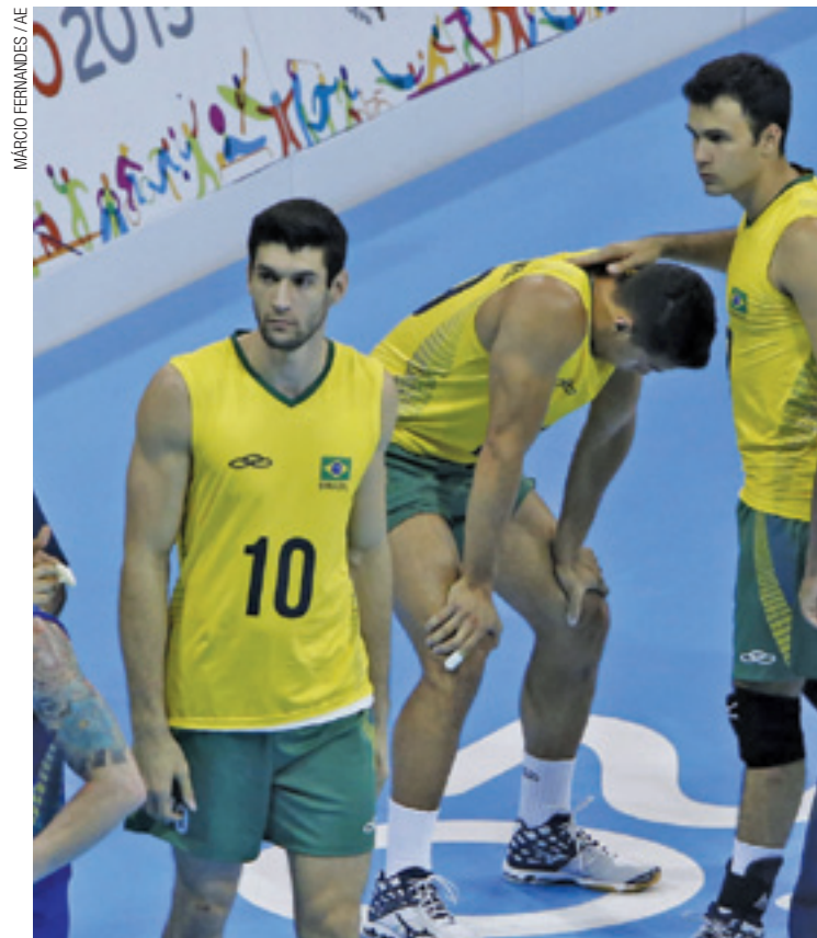
Prata - Jogadores lamentam derrota para rival sul-americano na final

Em Toronto, o vôlei brasileiro masculino não contou com os seus principais atletas e foi comandado por Rubinho, auxiliar de Bernardinho. A comissão técnica convocou uma equipe completamente reformulada para o Pan por dar prioridade para a Liga Mundial, na qual o Brasil foi eliminado precocemente na fase final em casa. Apesar do vice-campeonato, os garotos mostraram serviço e se colocam na briga por espaço para os Jogos Olímpicos do Rio.