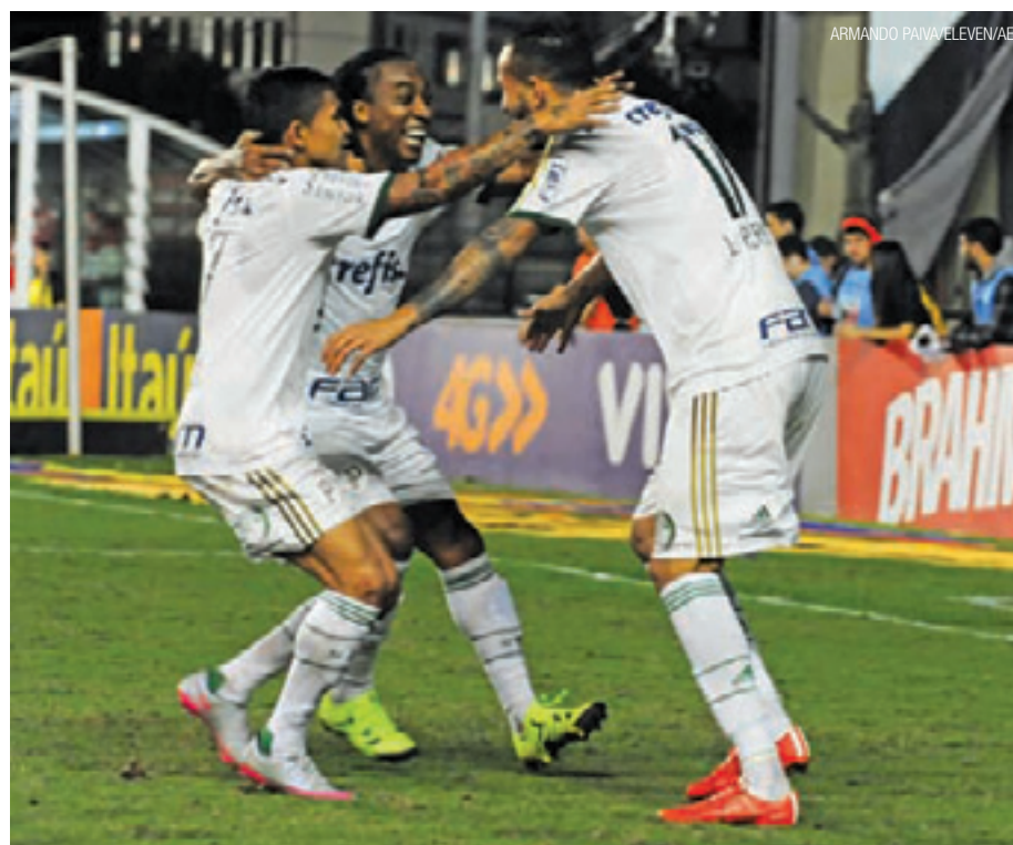
Demolidor - Palmeirenses comemoram gol. Foi a sétima vitória nas últimas oito partidas

Verdão dá show, goleia o Vasco e finalmente entra no G4 Caderno de Esportes