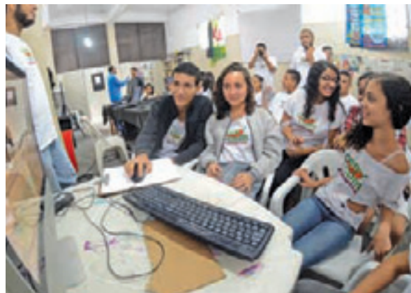
Prática - Estudantes editam os seus próprios trabalhos