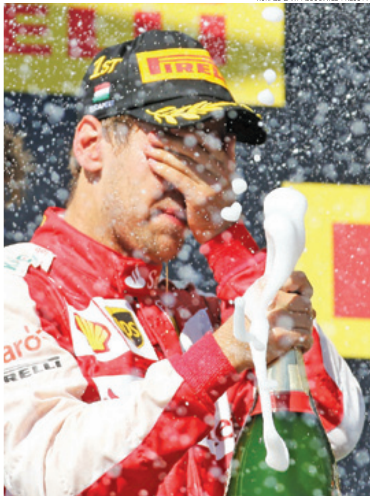
Histórico - Vettel alcança o posto de 3º maior vencedor da Fórmula 1

Os pilotos brasileiros também tiveram um domingo ruim em Budapeste. Felipe Massa, da Williams, recebeu uma punição logo no início da prova por posicionar o seu carro de modo errado no grid de largada e ficou fora da zona de pontuação. Felipe Nasr ficou apenas na 11ª posição.