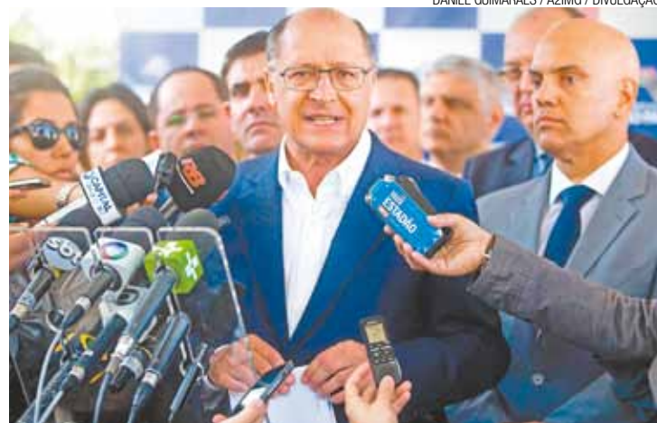
Coletiva - Governador Alckmin e o Secretário de Segurança, ontem

Foram mortos 67 entre janeiro e junho deste ano