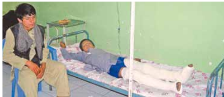
Violência - Além dos mortos, tiroteio deixou ainda oito feridos na festa