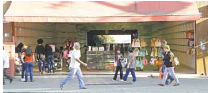
Cenário - Cidade teve redução de 3.360 vagas de trabalho em junho

todos os segmentos econômicos e isso provoca essa diminuição de massa salarial.