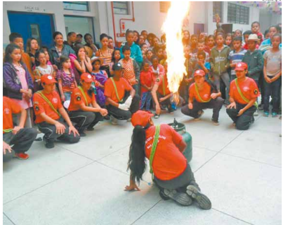
Aula prática - Alunos recebem orientação de instrutores sobre como lidar com botijão de gás de cozinha

1º Festival de Inverno Dia: 01 de agosto - Horário: 14h - Endereço: Rua Maracanã, 03 - Bonsucesso - Classificação: Livre Entrada gratuita.