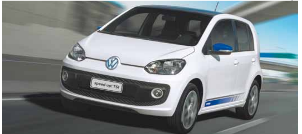
1.0 TSI Total Flex - Primeiro motor com injeção direta, turbocompressor e flexível produzido no País

O Up! TSI está disponível exclusivamente com a carroceria de quatro portas, nas versões move up!, high up!, black up!, red up!, white up! e cross up!. Todos trazem uma série de recursos eletrônicos de segurança, como M-ABS (controle de tração), alerta de frenagem de emergência e MSR (regulagem do torque do freio motor), entre outros.