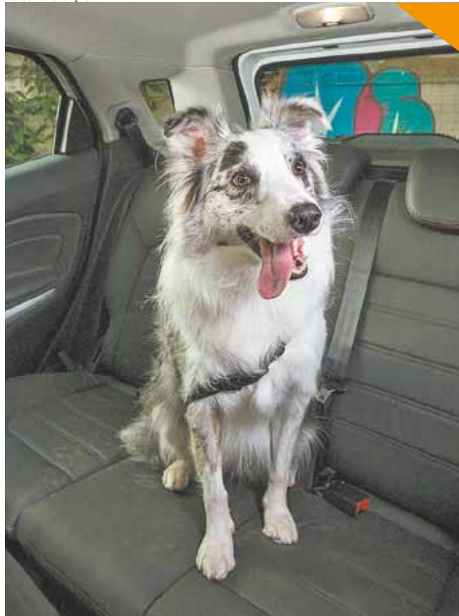
Segurança do pet - É indicado usar coleira peitoral presa ao cinto