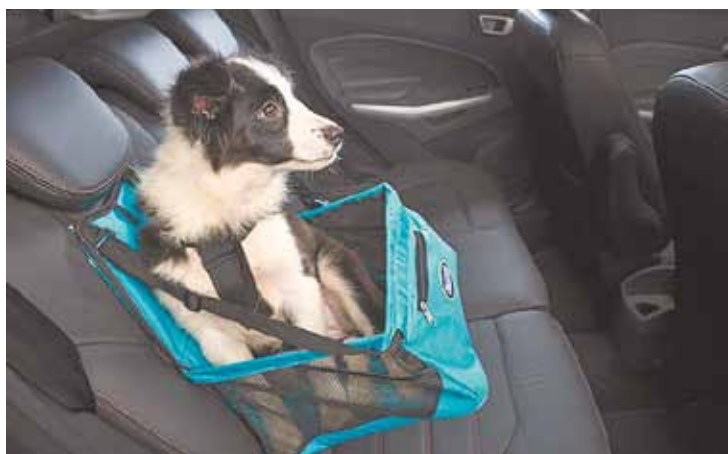
Filhotes - Caixa de transporte é recomendada para maior segurança