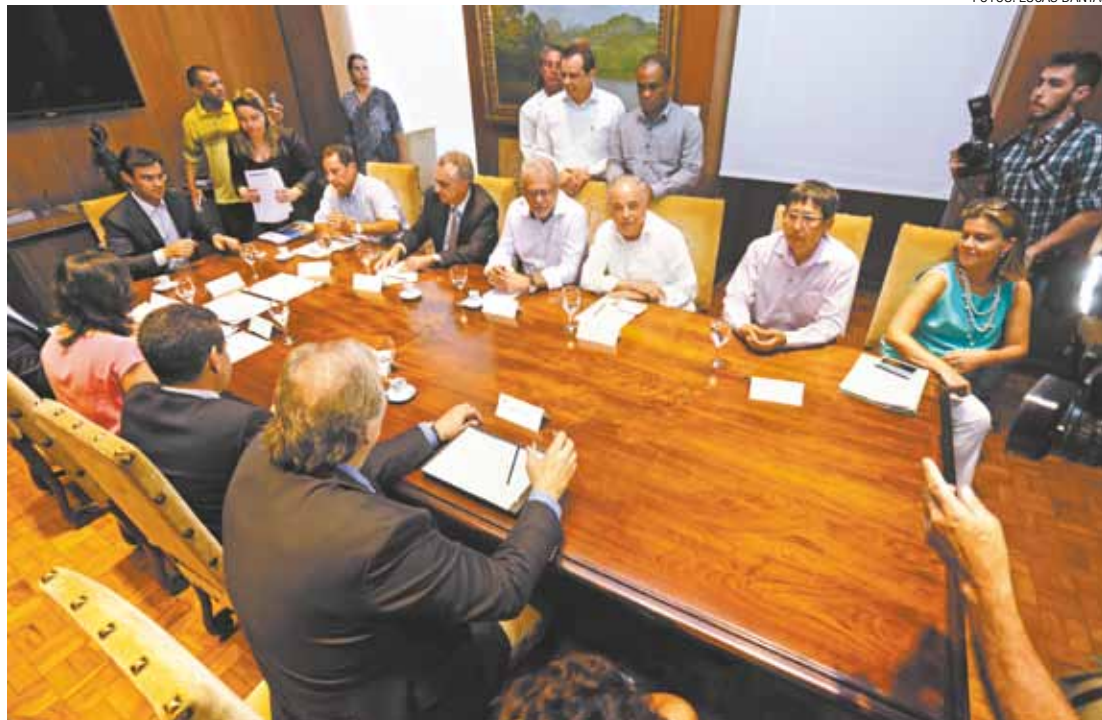
Parceria - Governo do Estado e prefeituras definiram detalhes do acordo em reunião no Palácio dos Bandeirantes

O Governo do Estado vai arcar, durante 20 anos, com todos os subsídios necessários para a continuidade da PPP. As Prefeituras se comprometeram a resolver questões legislativas e de zoneamento e com a construção de equipamentos públicos futuros.