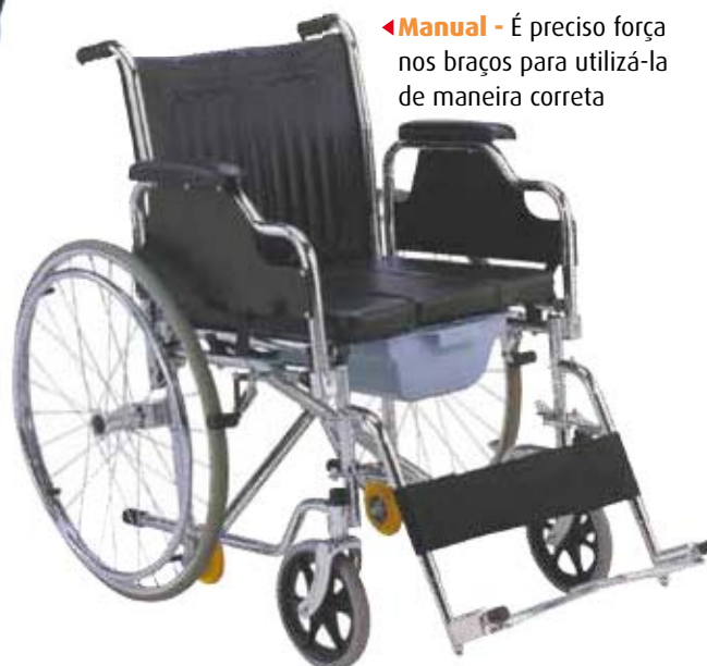
▶ Manual - É preciso força nos braços para utilizá-la de maneira correta