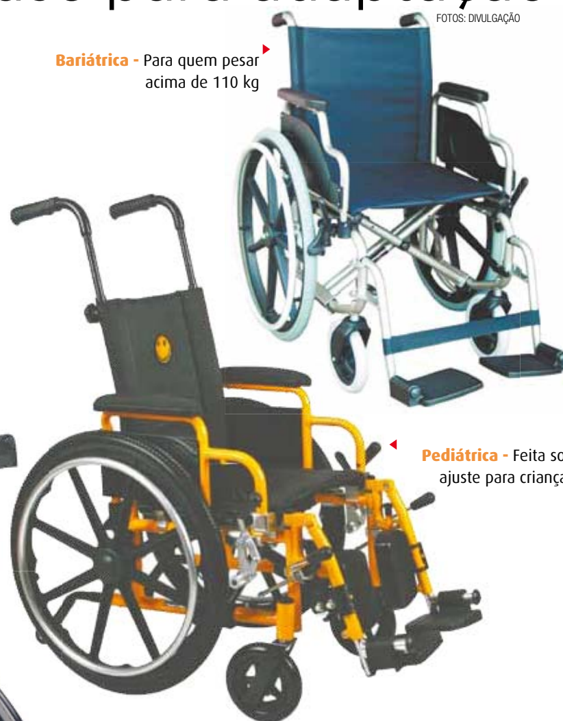
▶ Bariátrica - Para quem pesa acima de 110 kg