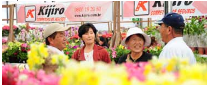
Feira - Evento tem mostra de flores e também muita gastronomia