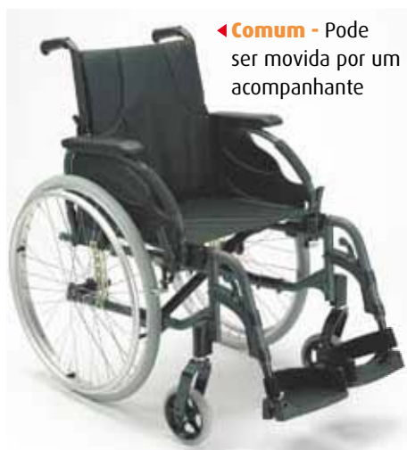
▶ Comum - Pode ser movida por um acompanhante