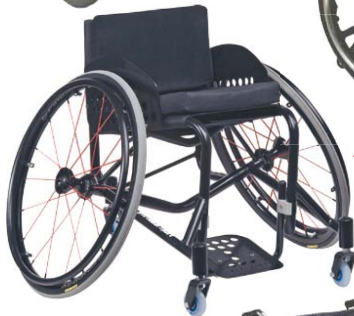
▶ Esportiva - Permite que os ocupantes disputem modalidades esportivas