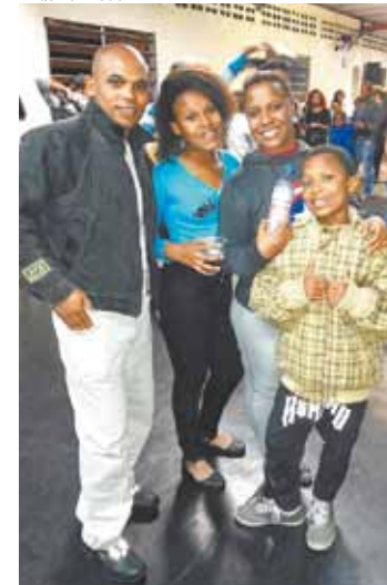
Unidos pelo samba - As aulas de dança são curtidas em família