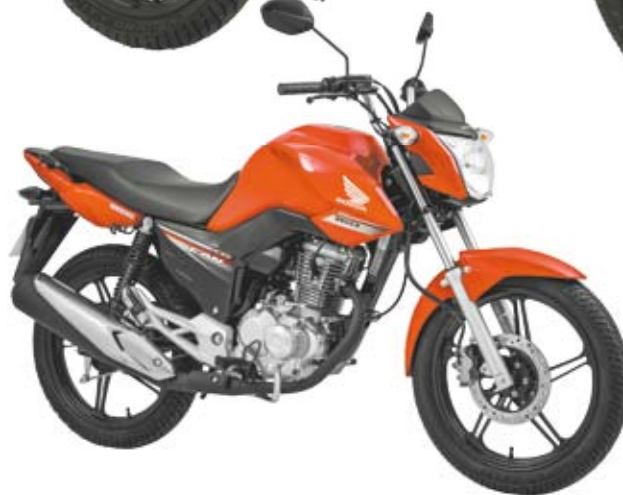
CG 160 Fan - Visual mais moderno e jovial, com novos grafismos

CG 160 Titan - Traz novidades exclusivas, como painel digital com tacômetro, e alças de apoio para o garupa em alumínio e removíveis