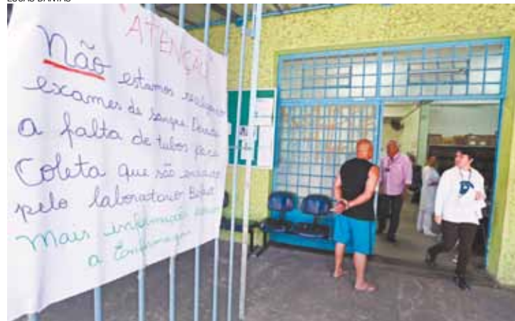
Comunicado - Cartaz manuscrito foi colocado no portão da unidade

A Empresa responsável pelo material, a Biofast, orientou a reportagem a questionar a Prefeitura sobre o assunto.