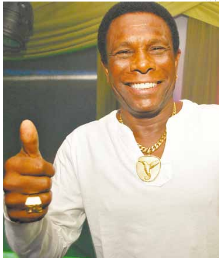
Tratamento - Curado, Neguinho da Beija Flor voltou a fazer shows