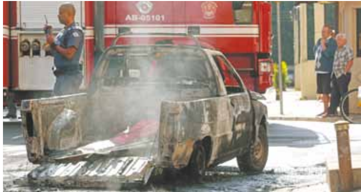
Sumido - Motorista não foi localizado até o fechamento desta reportagem