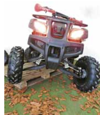
Força e resistência - Quadríciclo possui quadro tubular em aço de alta resistência e câmbio automático

Com motor 4 tempos, 4x2, a gasolina, sua potência é de 12 cv