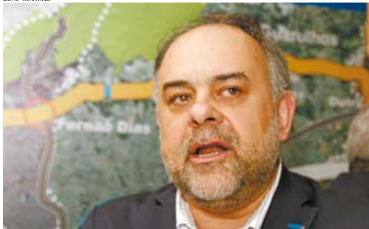
Acesso - Rodoanel terá ligação com o aeroporto, no terminal de cargas

Trecho Norte do Rodoanel será entregue em 2017