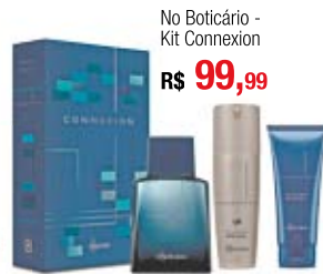
No Boticário - Kit Connexion R$ 99,99