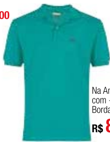
Na Americanas.com - Polo Lisa Bordado Poney R$ 89,90