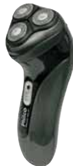
Nas Lojas Americanas - Barbeador PBA0203 Bivolt - Philco R$ 99,99