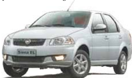
Na Fiat Sinal - Fiat Siena 1.0 2015 Ar Condicionado, volante com regulagem de altura, direção hidráulica, travas e vidros elétricos. A partir de R$ 36.790,00

lor cobrado era de R$ 649. Em outro, o mesmo modelo custava R$ 1.499. O levantamento foi realizado entre os dias 20 e 21 de julho, em 10 estabelecimentos da Capital. Em nota, o Procon recomendou que antes de comprar o presente, o consumidor faça uma pesquisa em lojas físicas e virtuais.