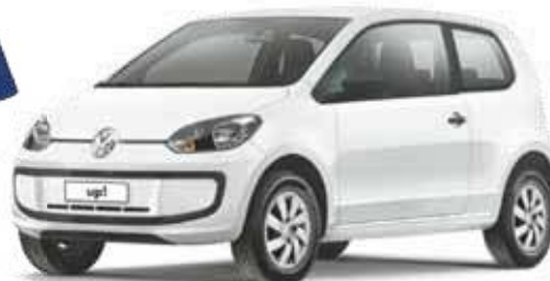
Na Brasilwagen - Take Up! Duas portas, básico - R$ 30.660,00