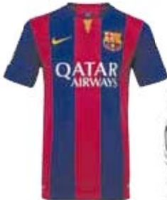
Na Centauro - Camisa Nike Barcelona 2014-2015 s-n R$ 199,99