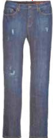
No Submarino - Calça lódice Masc. New Star Azul Médio R$ 177,90