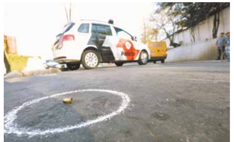
Crime e castigo - Assaltantes foram pegos na Avenida Benjamin Harris

A FOLHA METROPOLITANA NO SEU CELULAR! AGORA VOCÊ PODE LER, CURTIR E COMPARTILHAR