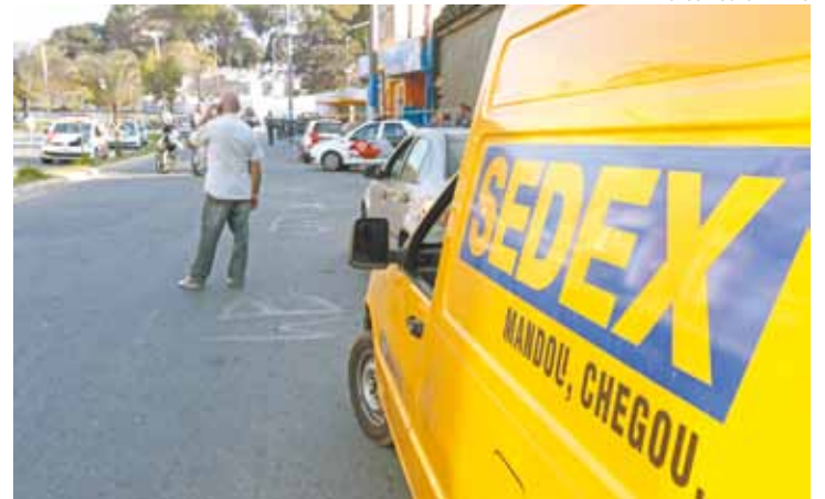
Correios - Homens tentaram levar cargas da empresa no início da tarde