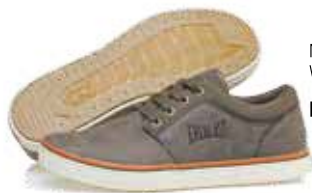
Na Netshoes - Tênis West da Everlast R$ 239