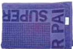
No Shoptime Toalha Banhão Avulsa Super Pai Casa & Conforto R$ 59,90