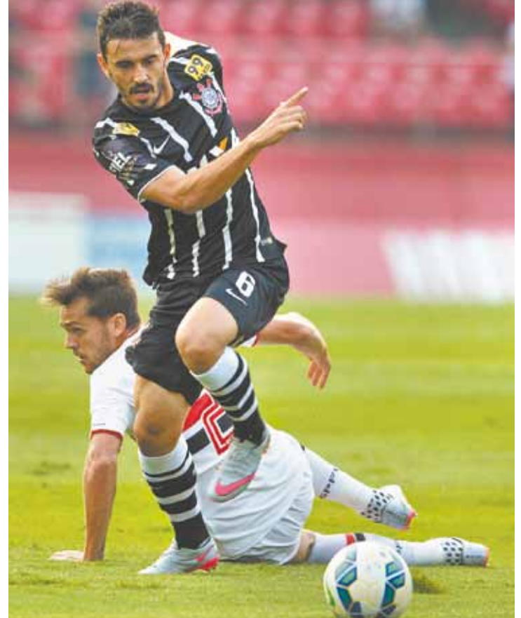
Jogoço - Clássico no Morumbi teve bom desempenho dos dois times