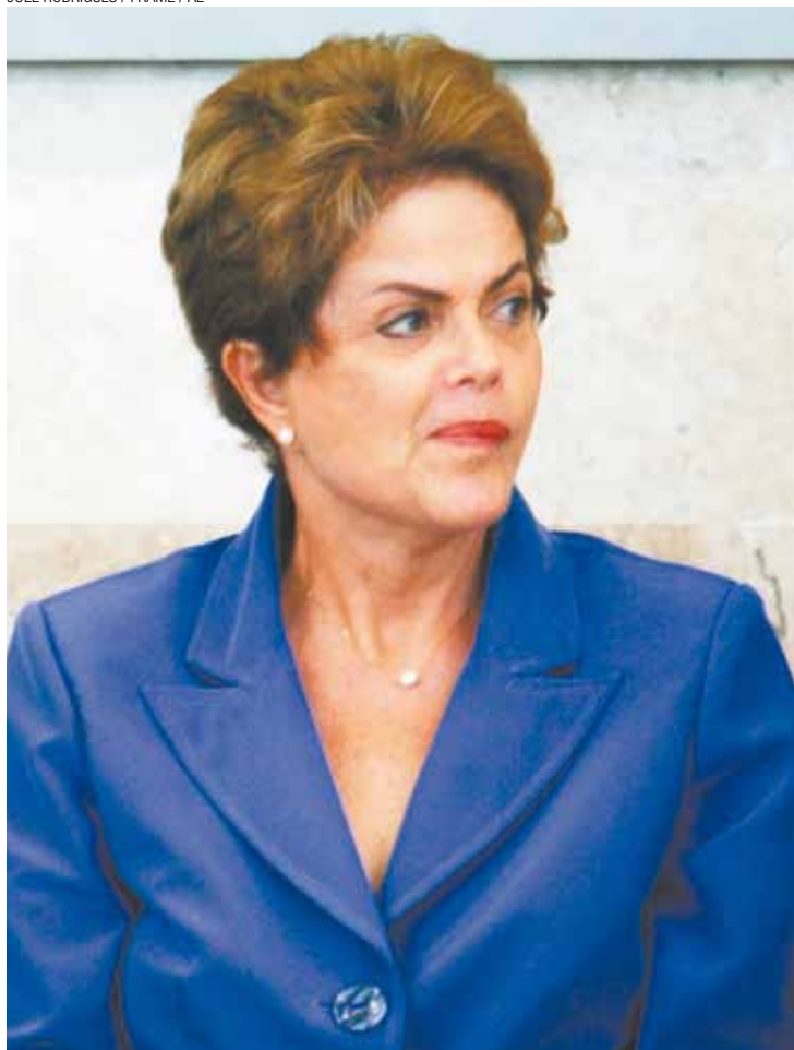
Lanterna - Datafolha mostrou que Dilma tem a pior rejeição da História