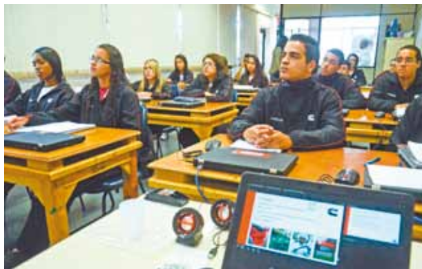
Atenção - Alunos têm também os benefícios da empresa