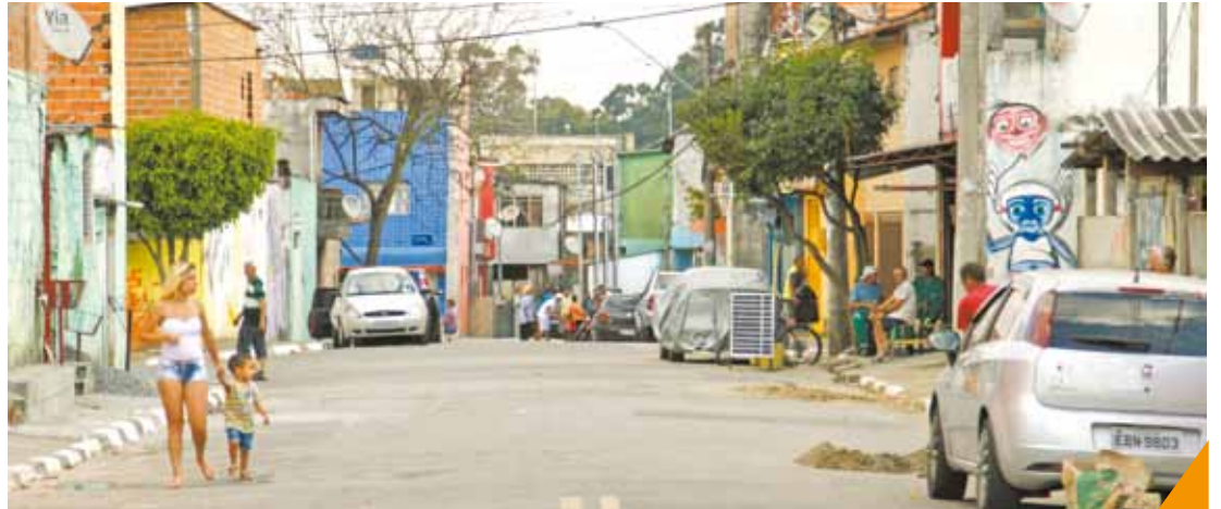
Informatização - Bairro usa a tecnologia para tentar diminuir os casos de violência na região

Todos os moradores ouvidos afirmaram que o problema se intensificou nos últimos três meses.