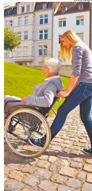
Carinho - Palavra de ordem para uma pessoa que abraça a profissão