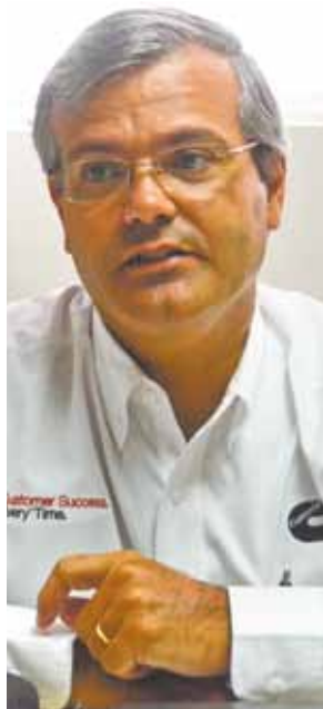
Rangel - Eles vão reforçar os seus conhecimentos