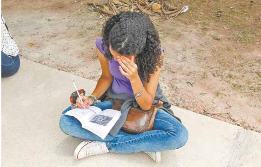
Dedicação - Garota estuda para se preparar para os vestibulares; na Fuvest, inscrição começa apenas no dia 21