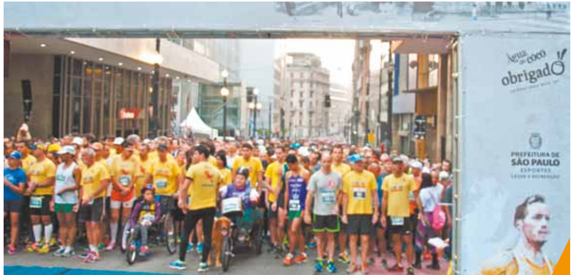
Marcante - Percurso de 9 km traçado pela organização contempla pontos turístico da capital paulista