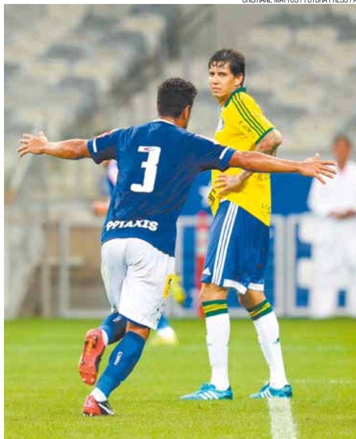
Mordeu - Jogador cruzeirense comemora gol, que garantiu vitória a Raposa

GOLS - Alisson, aos 4 minutos do primeiro tempo; Cristaldo, aos 29, e De Arrascaeta, aos 36 minutos do segundo tempo. CARTÕES AMARELOS - Willians, Vinicius Araújo e Fabrício (Cruzeiro); Victor Ramos, Egídio e Lucas (Palmeiras). ÁRBITRO - Wilton Pereira Sampaio (Fifa/GO). RENDA - R$ 781.710.00. PÚBLICO - 20.839 pagantes. LOCAL - Estádio do Mineirão, em Belo Horizonte (MG).