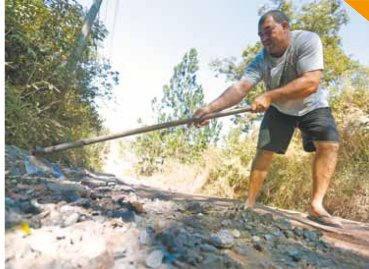
Esforço - Morador toma atitude para melhorar acesso à sua residência