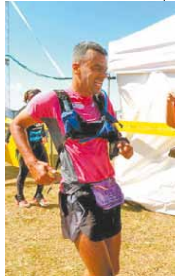
Chegada - Atleta de Guarulhos

Na KTR, ele terminou os 12 km em 1h04m11s. "Foram quase 2000 metros de desnível durante o percurso. Atrapalha a todos, mas para mim foi uma boa prova", afirmou.