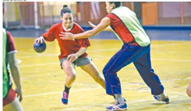
Treino - Nas "férias", além dos jogos extras, Fumguaru treinou muito