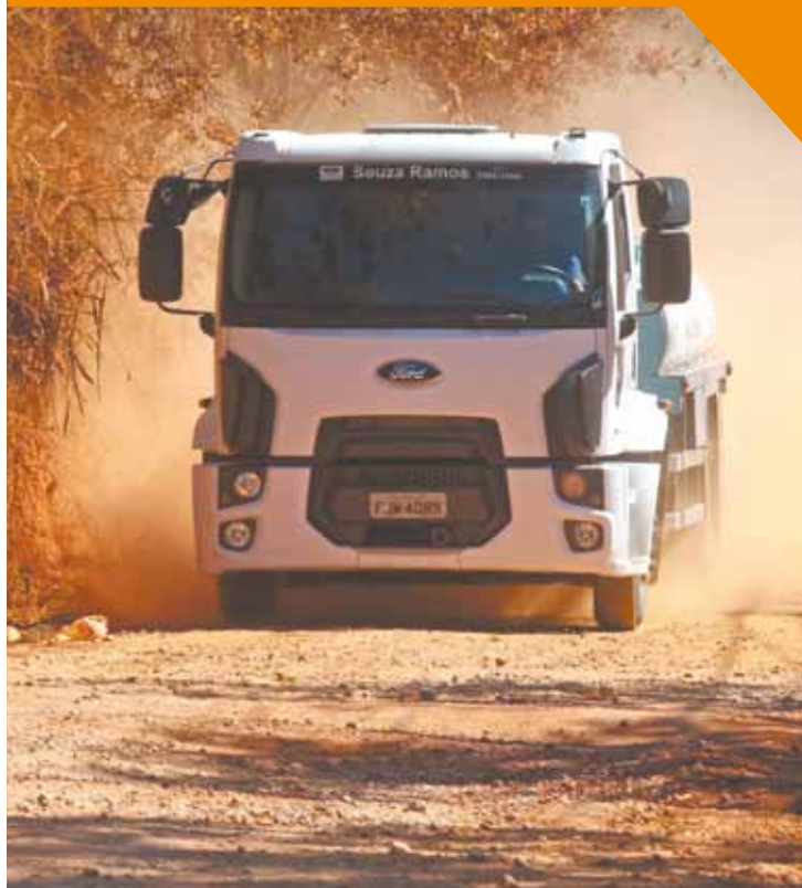
Água Azul - Caminhão cruza rua de terra e levanta cortina de pó