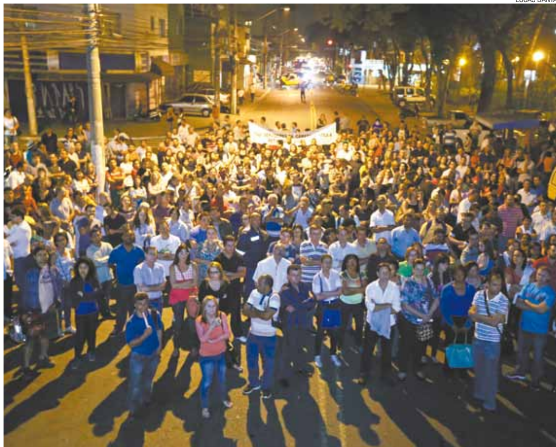
Rejeição - Sindicato e associações rejeitaram primeira proposta do regime apresentada pelo governo municipal

A lei que regulamentará o estatuto deverá ser encaminhada à Câmara para aprovação até setembro, visto que a meta do Executivo é que todo servidor público esteja dentro do novo regime até o dia 1º de janeiro de 2016.