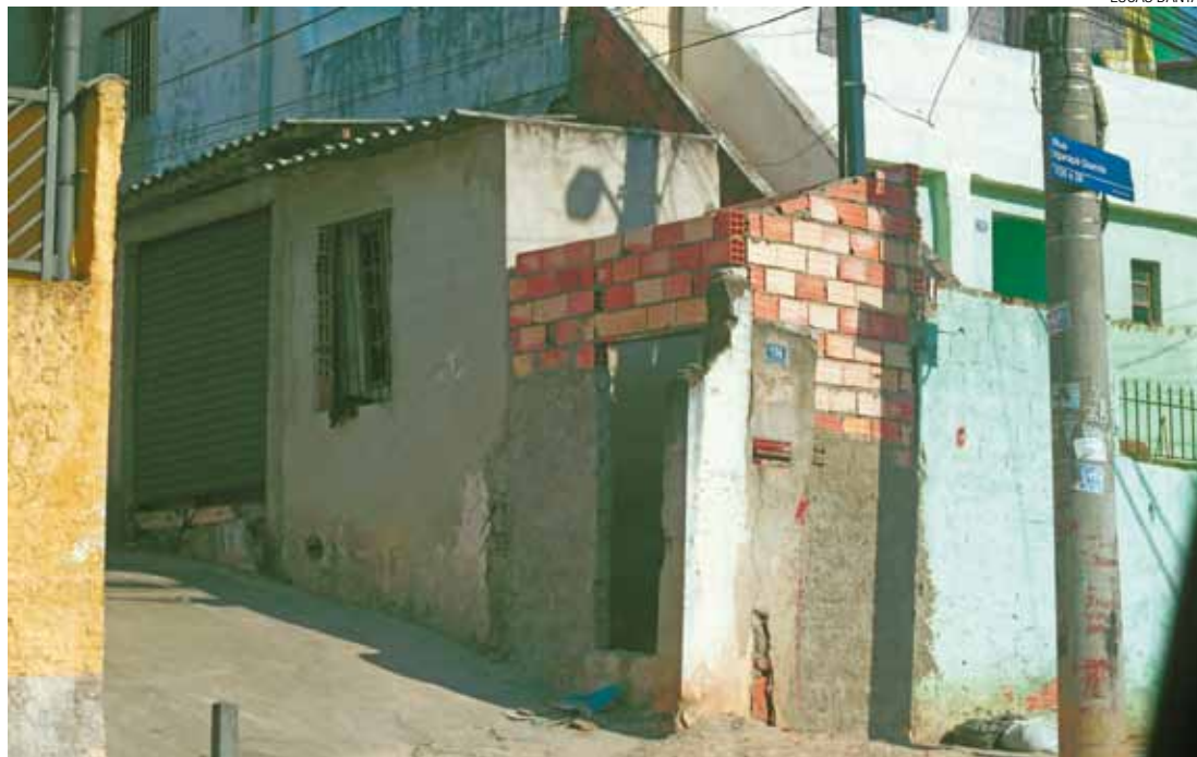
Via pública - Salões e moradias estão em construção na Rua Olho D'Água das Flores, no Jardim Carvalho

Em 2013, a Secretaria de Desenvolvimento Urbano (SDU) disse que havia um processo para ações subsequentes. Procurada desde o dia 10, o governo não respondeu à reportagem.