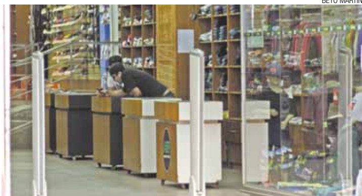
Demissões - Setor de produtos têxteis foi impactado pelas poucas vendas