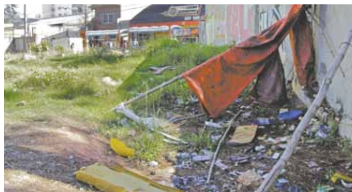
Descarte irregular - Materiais são jogados em vários pontos do terreno