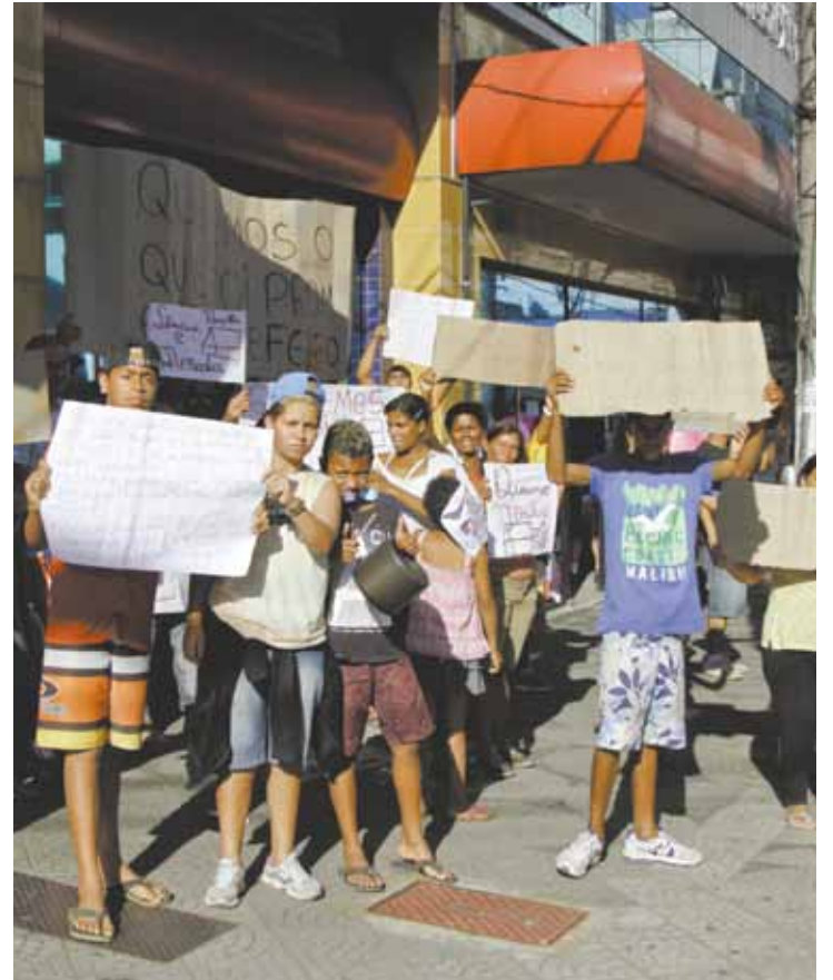
Socorro - Moradores querem que Prefeitura ceda nova moradia a eles

“Guarulhos é a primeira cidade, além da Capital, que consegue a aprovação de um projeto desses junto ao governo federal”, ressaltou Fantazzini.