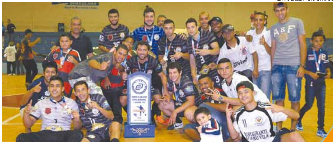
Festa - Jogadores da equipe da Vila Augusta comemoraram o principal título da cidade no futsal

Catados da Vila e Leões de Judá decidem o título