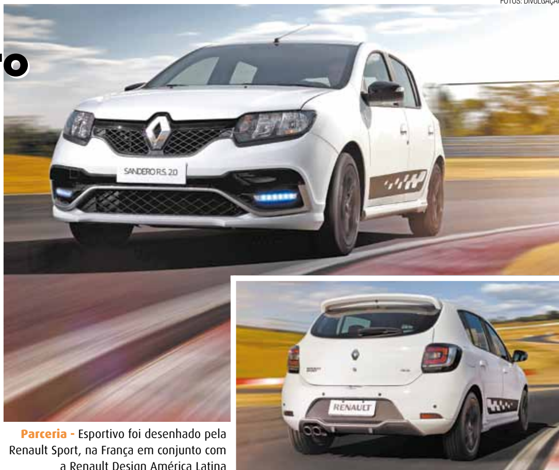
Parceria - Esportivo foi desenhado pela Renault Sport, na França em conjunto com a Renault Design América Latina

Com motor 2.0 aspirado que entrega 150 cv, associado a uma caixa de câmbio manual de 6 velocidades com relações curtas para maior esportividade, o hot hatch atinge a velocidade máxima de 202 km/h e vai de 0 a 100 km/h em apenas 8,0 segundos. O Sandero R.S. 2.0 se destaca por sua capacidade de proporcionar sensações esportivas desde o primeiro toque no acelerador, além de muito prazer na utilização diária.