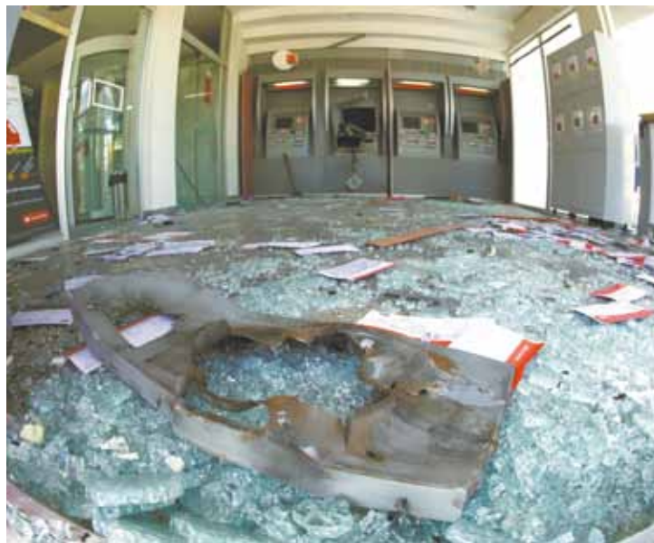
Dúvida - Não foi confirmado se os criminosos conseguiram levar dinheiro