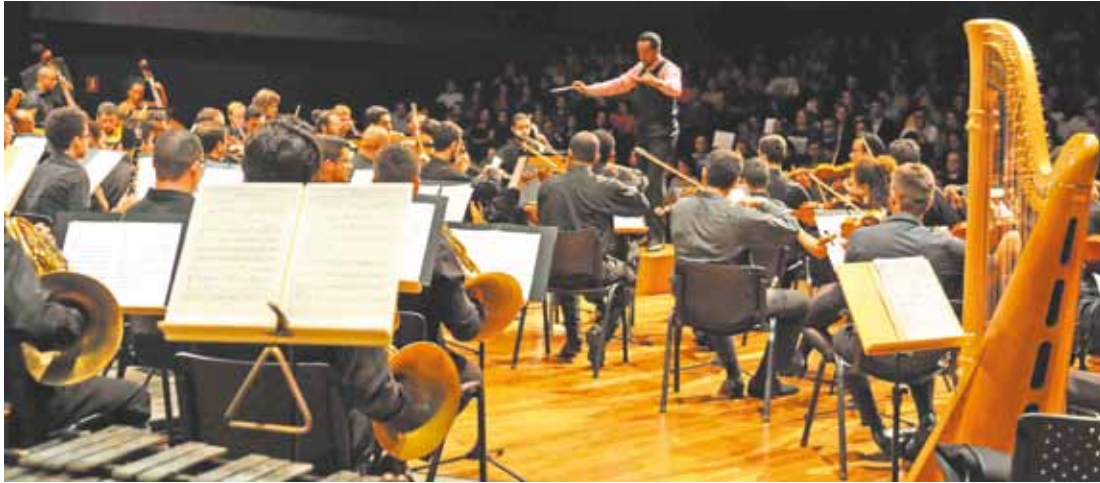
Música - Regente avalia que apresentação de sábado tem como tema a relação entre a música e a narrativa