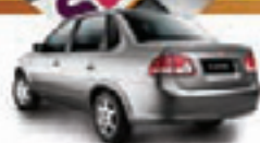
CLASSIC 1.5 11 PL-0358, OPORTUNIDADE R$ 17.990,