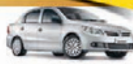
VOYAGE 1.0 10 PL-6880, CE R$ 21.900,