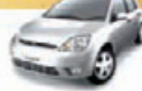
FIESTA HT 1.0 06 PL-8622, VVILIMP. E DESB. R$ 15.900,