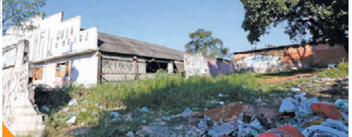
Abandono - Reportagem verificou que homens aparentemente vendiam drogas à luz do dia no local

Nos imóveis ocorre supostamente o uso de drogas