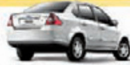
FIESTA SEDAN 1.6 FLEX 11 PL-2656, AR/DHICE R$ 27.900,