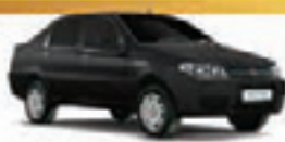
SIENNA FIRE 08 PL-7238, AR/DHICE R$ 18.990,