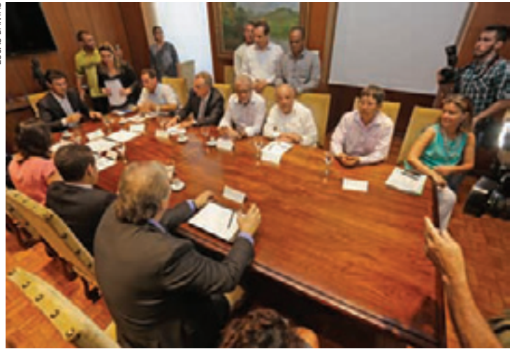
Parceria - Governo do Estado e Prefeitura definiram detalhes em reunião

Sete mil moradias serão destinadas ao interesse social