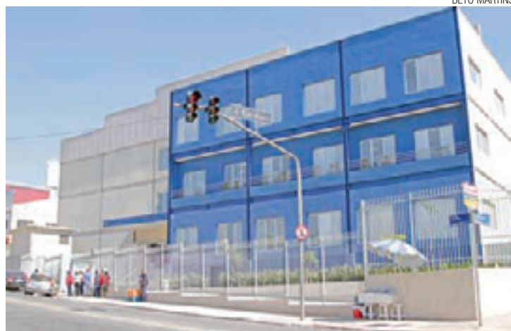
Agora vai - Unidade local da empresa estava prometida para fim de 2013

A instalação no município foi antecipada na ocasião pela Folha Metropolitana com exclusividade. O setor de serviços local havia empregado