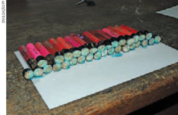
Mala - Seis quilos de cocaína estavam escondidos dentro de 252 batons

Segundo a PF, por volta das 19h30, uma filipina de 24 anos foi abordada por policiais no check-in de um voo