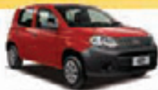
UNO 4P VIVACE 1.0 8V FLEX 12 PL-3828, NOVISSIMO R$ 23.900,