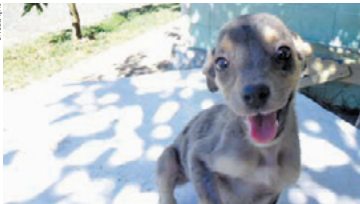
Saudáveis - Animais já estão castrados e medicados contra vermes

sibilidade de adoção dos animais durante a semana. Para isso, basta entrar em contato para mais informações no próprio local, ou pelo telefone 2436-3666. O órgão funciona de segunda a sexta-feira, das 8h às 17h.