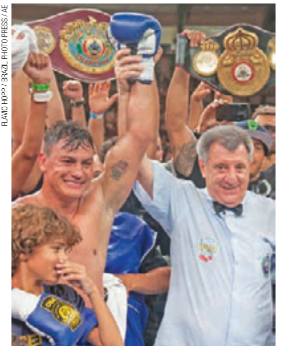
Alegria - Popó garantiu a 40ª vitória da carreira em 42 combates. Ele conquistou ainda o seu 34º nocaute

No terceiro round, Popó foi muito preciso para encaixar os golpes. Derrubou "El Chino" logo aos 30 segundos, o mandou para o chão de novo pouco depois e por fim o demoliu com potente "upper" que o atingiu no queixo.