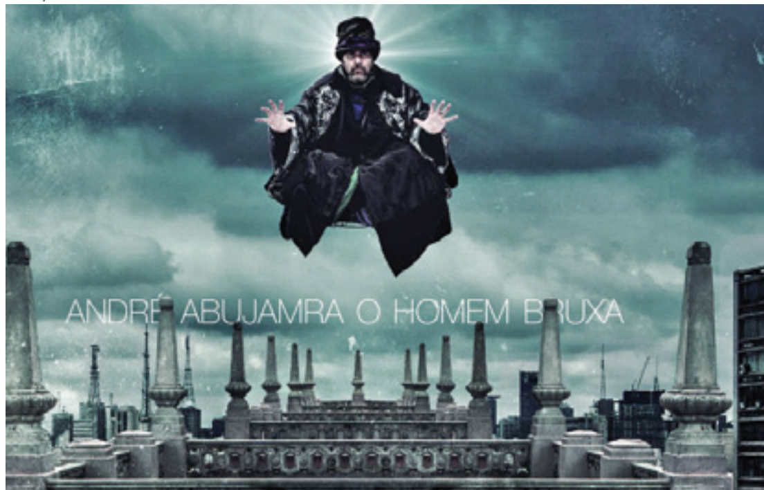
Sucesso de crítica e público - André Abujamra irá se apresentar no Rock in Rio, em setembro