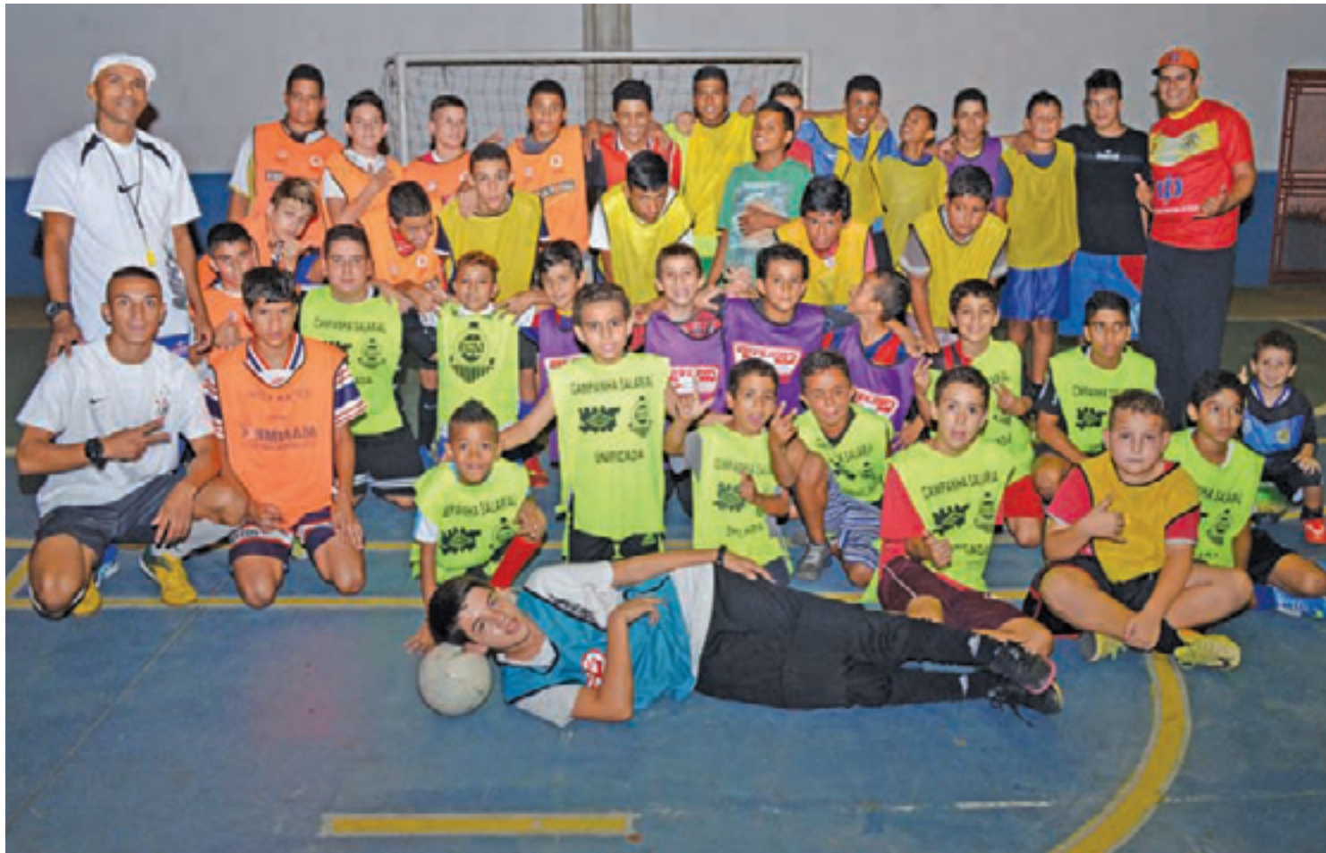
Social - Crianças e jovens de 5 a 18 anos participam do projeto que, além da atividade física, oferece disciplina, comportamento e boas maneiras

"As crianças que frequentam o projeto estavam em vulnerabilidade social, nas ruas. Até mesmo conviviam com drogas ou outro tipo de atividade que não completavam a sua vida. Passaram a praticar o