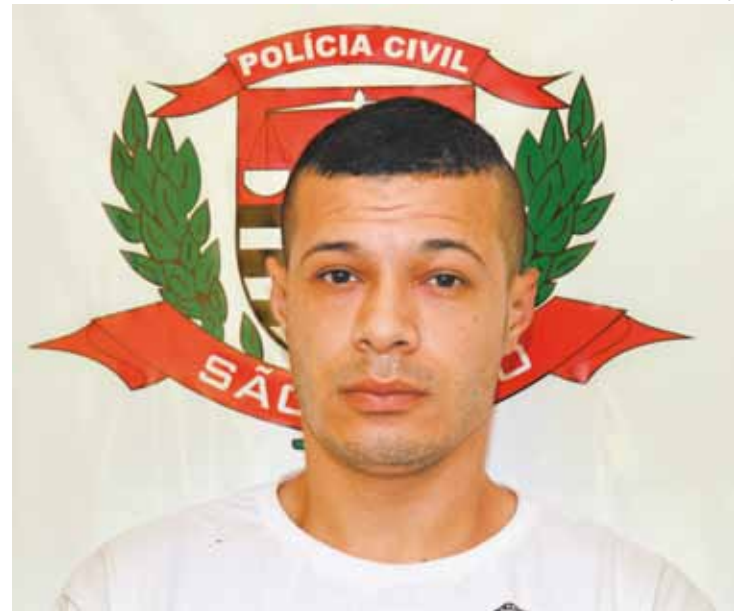
Frieza - Gomes afirma que vítima "foi pra cima" e por isso atirou contra ela