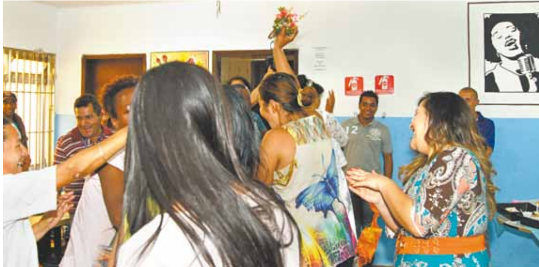
Alegria - Cerimônia contou com trio de cantores do grupo Domnia, comes e bebes e a "hora do buquê"