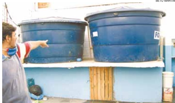
Criativa - Transportadora elaborou projeto para estocar água da chuva

Principal transtorno é a dificuldade para tomar banho