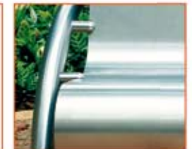
Chapas de Inox