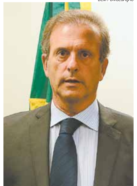
DEM / DIVULGAÇÃO