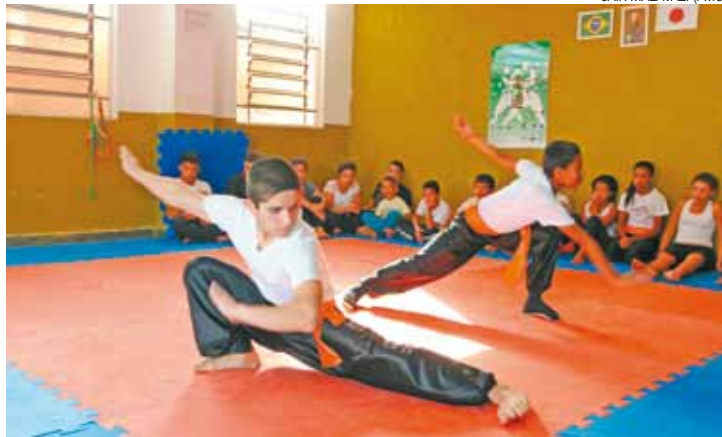
Kung Fu - Disciplina e técnica das artes marciais atraem muitos jovens

Mantido pela Prefeitura de Guarulhos, por intermédio da Secretaria Para Assuntos de Segurança Pública, o Projeto Paraíso conta com o trabalho de 18 instrutores, todos GCMs voluntários, que ensinam Judô, Jiu-Jitsu, Boxe Chinês, Kung Fu, Tai-Chi-Chuan, canto, violão e informática a cerca de 400 estudantes.