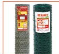
Telas para Cercamento