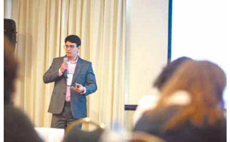
Palestra - Fábio Rabbani falou sobre infraestrutura aeroportuária

Ontem, em workshop de aviação promovido pela Gru Airport no Hotel Marriott, o superintendente de infraestrutura da Agência Nacional de Aviação Civil (Anac), Fábio Rabbani, afirmou que a empresa não recebeu nenhuma