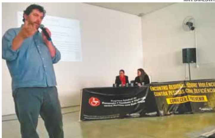
Encontro - Palestrantes se aprofundaram sobre a questão da violência

Os dados foram divulgados ontem no 8º Encontro Regional sobre Violência contra Pessoas com Deficiência, realizado no Centro Municipal de Educação Ada-