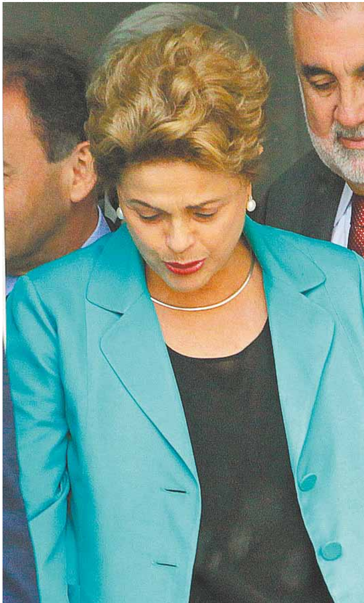
Vacilou - Presidente contou que errou ao constatar tardiamente a crise