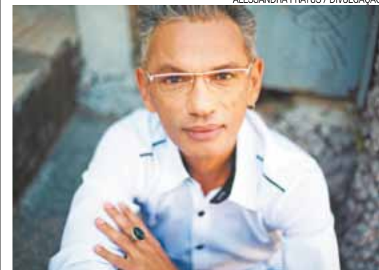
'Abre a Janela' - CD do cantor cearense Zé Guilherme