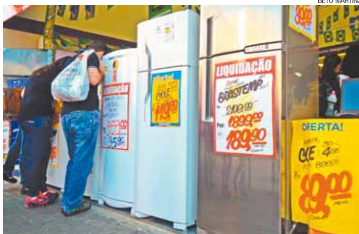
Dívidas - Bens adquiridos com cartão de crédito têm estourado orçamento

Segundo os dados, 76% dos consumidores inadimplentes que tomaram empréstimo em bancos e financeiras disseram estar com o nome sujo por causa de atrasos no pagamento. O percentual é maior do que