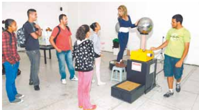
Adamastor - Evento será realizada durante a 4ª edição da Semcitech