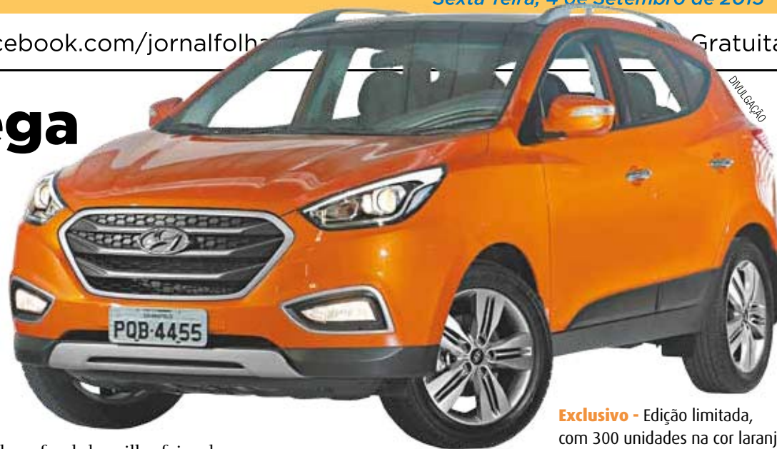
Exclusivo - Edição limitada, com 300 unidades na cor laranja

Produzido na planta da CAO A Montadora, em Anápolis (GO), o Hyundai New iX35 Flex traz um design externo com ainda mais requinte e sofisticação. Seu visual dianteiro foi totalmente renovado e marcado principalmente pela proeminente grade com três filetes foscos cobrindo parcialmente uma colmeia interna, ambas contornadas pela moldura em formato hexagonal. Completando o pacote de mudanças na dianteira do mode-