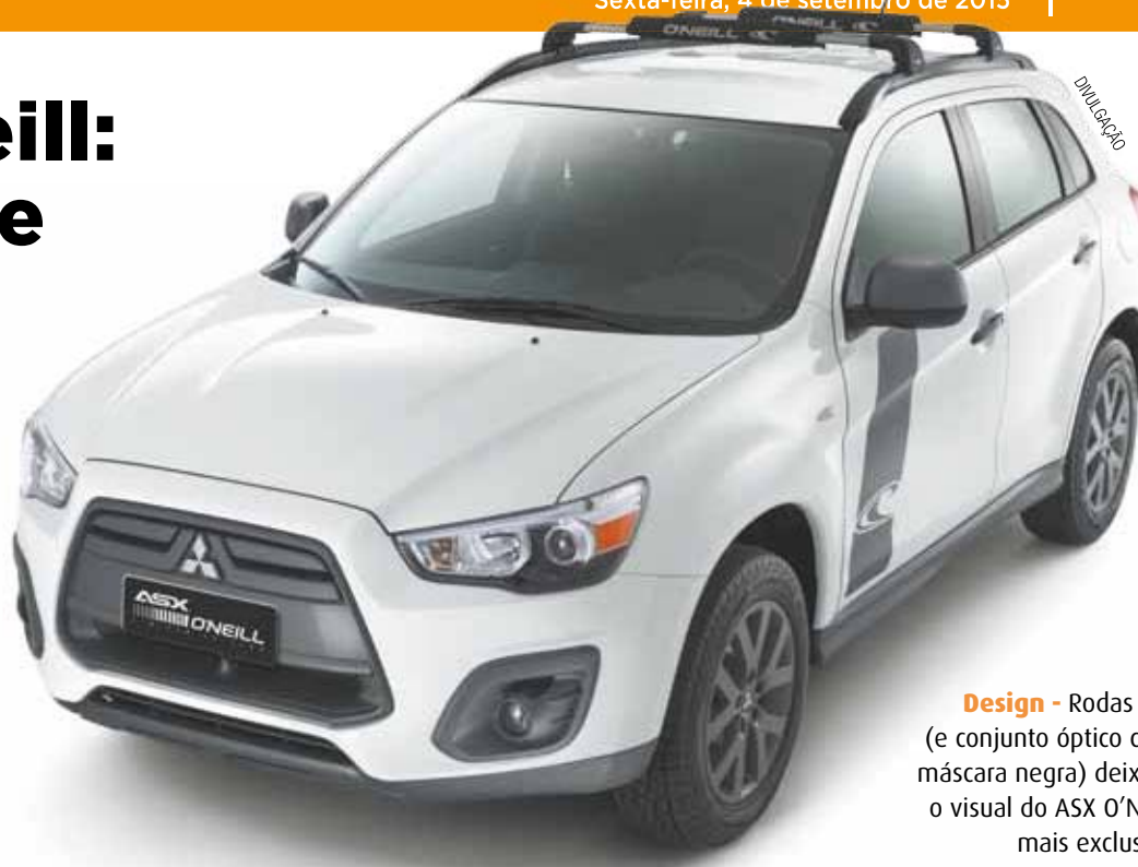
Design - Rodas 17 (e conjunto óptico com máscara negra) deixam o visual do ASX O'Neill mais exclusivo