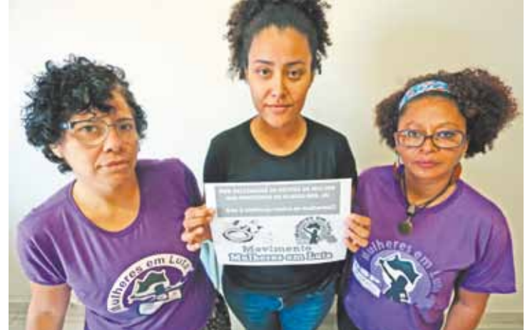
Abaixo-assinado - Integrantes do MML começam campanha segunda

Não há projeto para delegacia, diz Segurança Pública