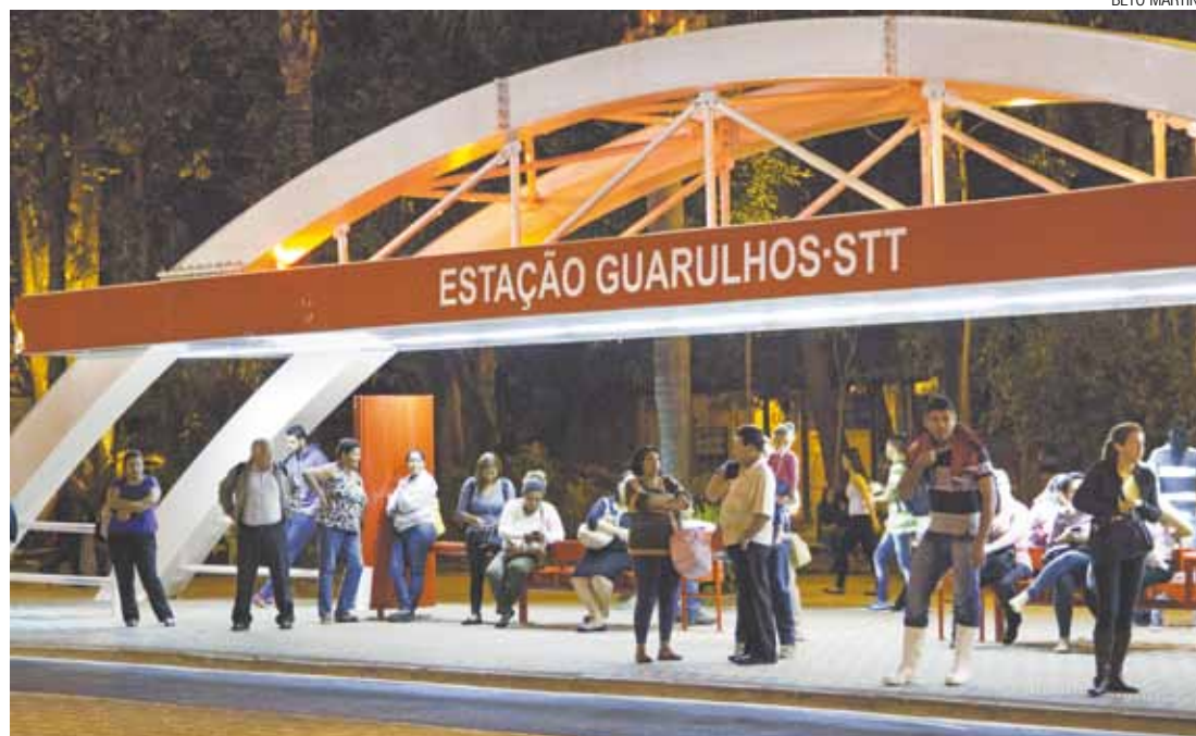
Evolução - Estações de transferência contam com iluminação, informação, cobertura e lixeiras para os usuários

Estação Pimentinha é uma referência ao Terminal de ônibus Pimentas