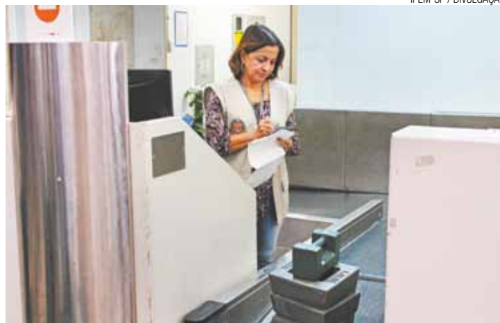
Campeã - 10 das 114 balanças da GRU foram autadas como irregulares

Sete aeroportos do Estado foram fiscalizados