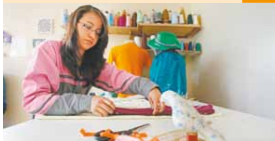
Costura - Pais também são beneficiados com o projeto

O Instituto "Meu Futuro" se mantém por doações de pessoas físicas e jurídicas. Empresas podem fazer doações em dinheiro, com dedução fiscal. Também podem ser feitas doações de alimentos, material escolar, produtos de limpeza e higiene, roupas esportivas ou equipamentos para atividades didáticas.