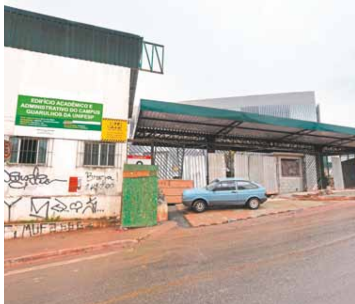
Graduação - Campus Guarulhos é voltado para cursos de Humanas

da autorização e pactuação com o MEC, para que tenhamos os recursos orçamentários e de pessoal (docente e técnicos), além de novo espaço físico. Embora tenhamos o desejo de aumentar a oferta de ensino superior no campus, não há previsão de quan-