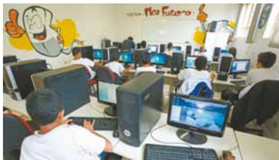
Informática - Alunos aprendem noções de computação