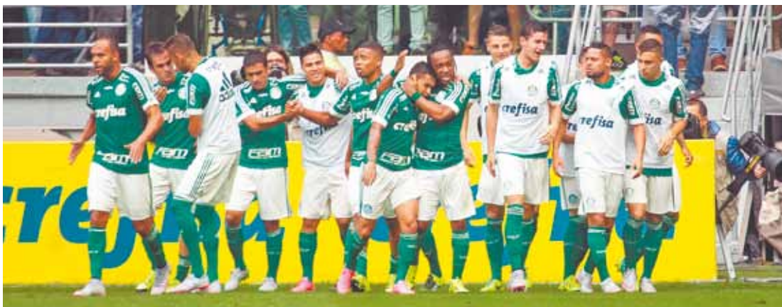
Faltou pouco - Verdão comemora um dos três gols da partida. Apesar de abrir as vantagens, não venceu