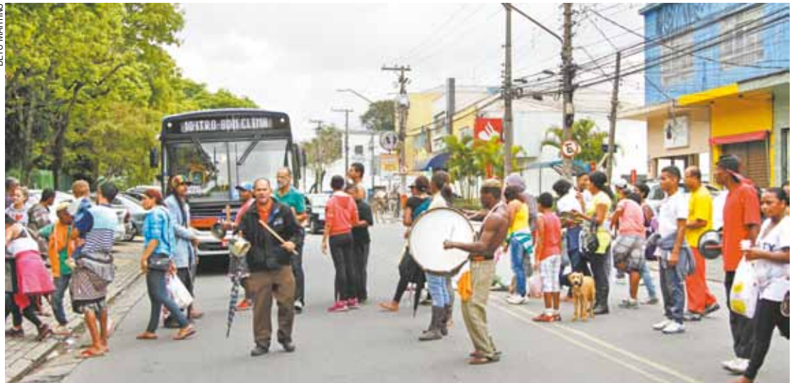
Revindicação - Grupo de moradores foi ao Paço Municipal e interditou via para cobrar apoio do prefeito

A associação receberá uma resposta do governo hoje.