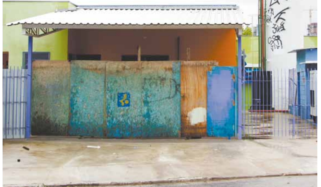
Não foi desta vez - Entrada da futura unidade de saúde tem tapumes na frente e a caixa d'água foi pichada

Unidade de saúde está equipada com macas e outros móveis