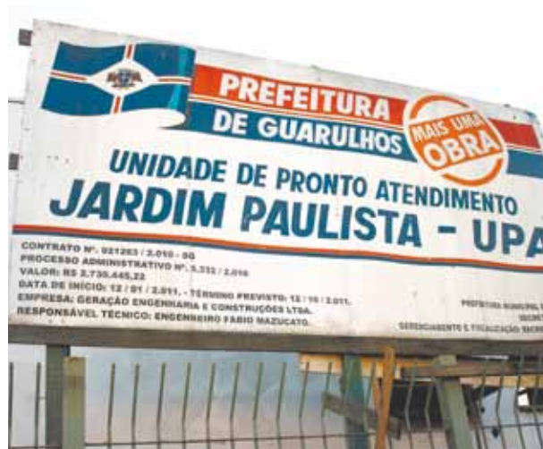
Promessas descumpridas - Placas mostram as datas de início e término previsto para a conclusão da obra

a obra sofreu atraso porque a empresa inicialmente contratada para a construção da UPA, Geração Engenharia e Construções Ltda, apresentou problemas financeiros e diminuiu o ritmo de execução dos serviços, paralisando completamente as atividades no final de 2012. Por isso, antes de contratar nova empresa, a Prefeitura teve de adotar as medidas jurídicas pertinentes e isso retardou o cronograma previsto.