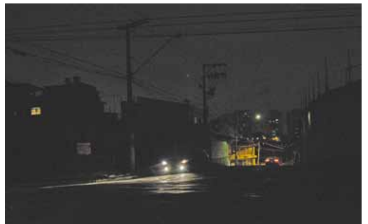
Falta de luz - Escuridão tomou ruas da cidade na noite de anteontem

46 ligações Foram feitas para o Saae anteontem