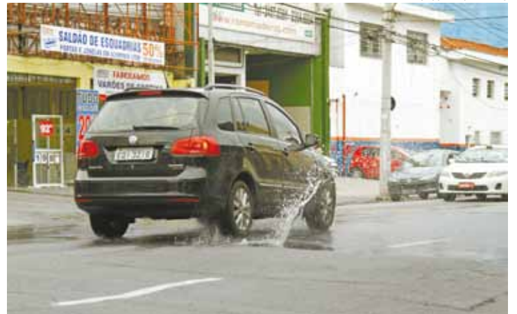
Esgoto - Água com mau cheiro invadiu Avenida Dr. Timóteo Penteado