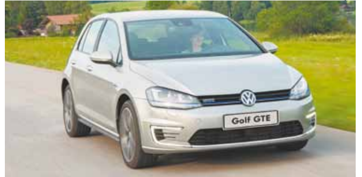
Desempenho - Modelo pode percorrer até 50 km em modo elétrico

O novo Golf GTE tem dois motores: um a combustão de 1,4l TSI com 150 cv e um motor elétrico de 75 kW (102cv). Combinados, oferecem potência de 150 kW (204 cv). Se o motor elétrico for a única fonte de força de propulsão, o Golf GTE pode atingir velocidades de até 130 km/h.