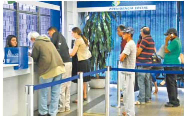
Procurador - Qualquer agência do INSS deve cadastrar os procuradores

Operação deve ser feita para que benefício continue