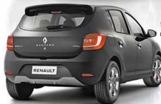
Destaque - Cor Dark Metal foi escolhida para ressaltar detalhes esportivos