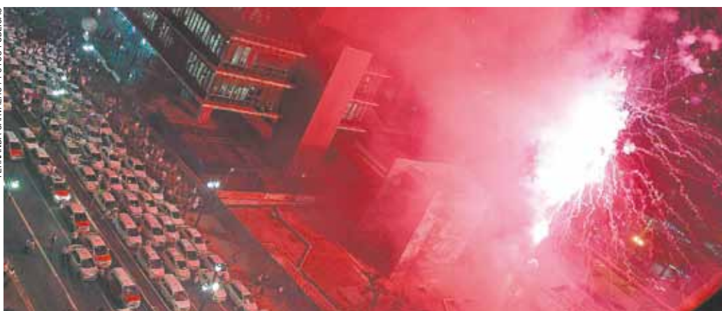
Festa - Taxistas comemoraram proibição do Uber com chuva de fogos em frente à Câmara Municipal