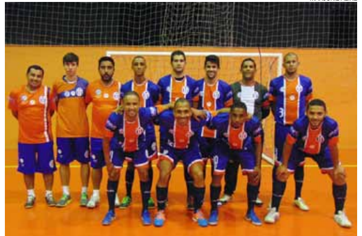
Na raça - Guarulhense espera vitória para garantir a classificação