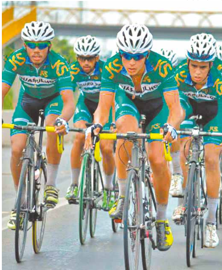
Velocidade - Atletas vão usar a prova como forma de preparação