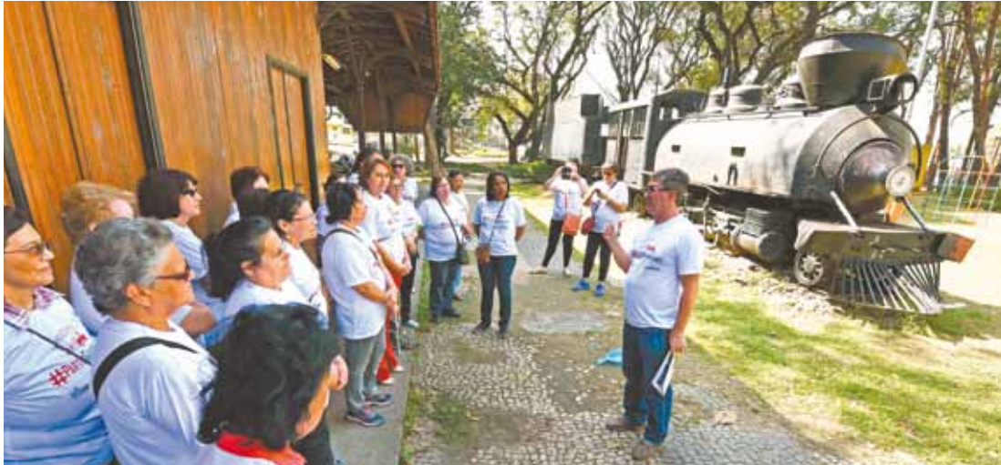
Turismo - No século XX, trem percorria diversas estações instaladas na cidade no transporte de passageiros