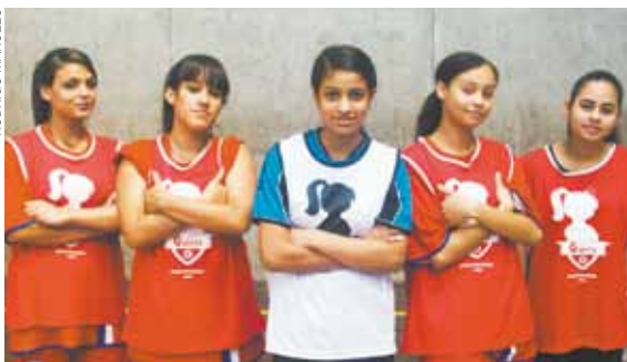
Joga Garota - Meninas também tem espaço no projeto