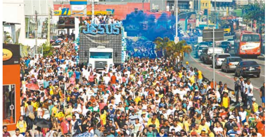
2014 - Centenas de pessoas marcharam da Paulo Faccini à Transguarulhense, onde houve um show Gospel