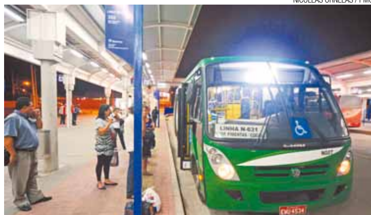
NICOLLAS ORNELAS / PMG