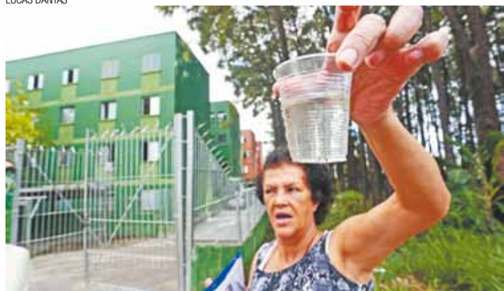
Na bronca - Moradora segura copo com larvas do mosquito da dengue

Em razão do surto, a Prefeitura teve de alugar tendas para atender pacientes suspeitos, pois os hospitais municipais superlotaram no primeiro semestre.