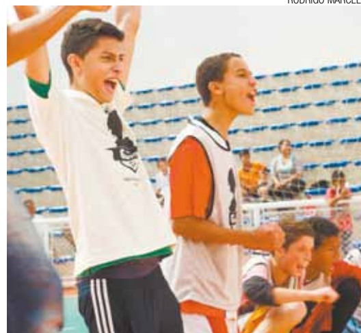
Valorização - Participantes do JB12 são respeitados