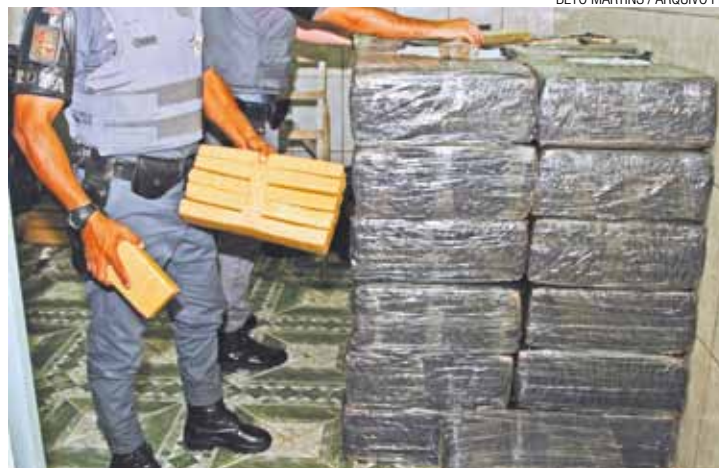
Segurança - Instituto garante anonimato e dados auxiliam polícia

O programa do Instituto São Paulo Contra Violência auxilia investigações da polícia e registra acusações de quem