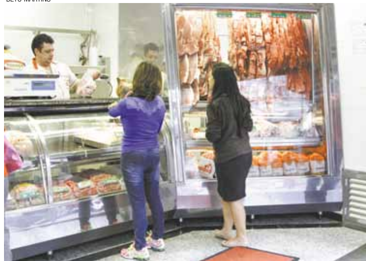
Economia - 65% dos consumidores passaram a comprar menos carne