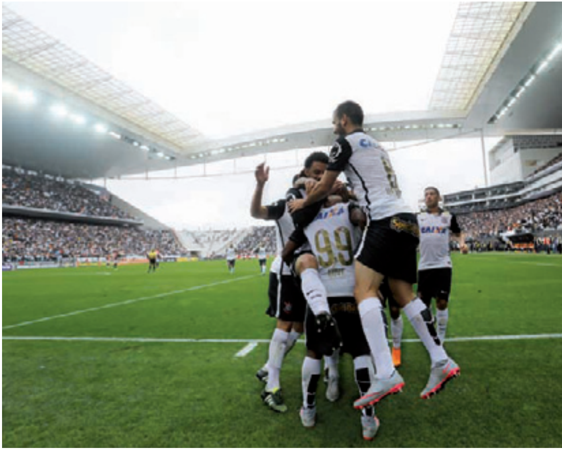
NELSON ANTONIÉ / FRAIFE / AÉ

ESTADÃO CONTEÚDO - No seu primeiro jogo às 11h no Campeonato Brasileiro, o Timão não decepcionou o torcedor que lotou a Arena Corinthians ontem. Em clima de festa, com direito a show de samba antes do jogo, e diante de 41.809 pagantes (recorde de público na arena), o Alvinegro bateu o Joinville por 3 a 0 com extrema facilidade e chegou aos 54 pontos.