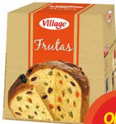
Panettone Village Frutas 500g