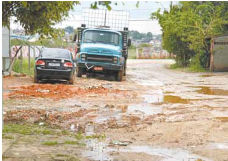
Terra e lama - Rua Salgadinho fica intransitável em dias de chuva