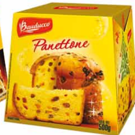
Panettone Bauducco Frutas 500g