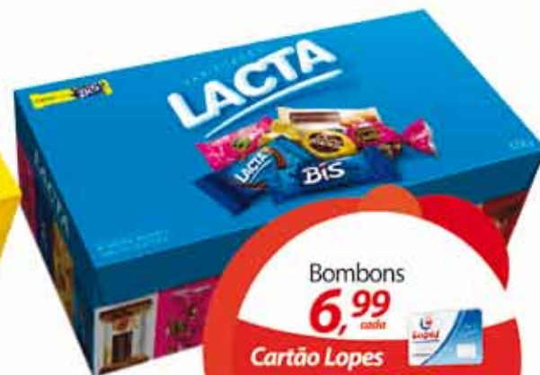
Bombom Brand Mix Lacta Variedade 332g