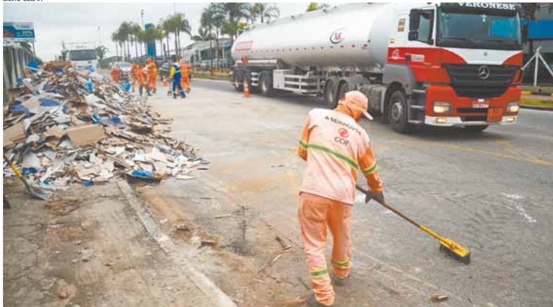
Limpeza - Funcionários da CCR NovaDutra tiveram que retirar os pisos para facilitar o tráfego no local