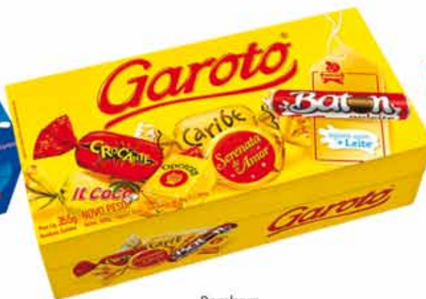
Bombom Sortido Garoto 300g