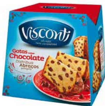
Panettone Visconti Gotas de Chocolate 500g