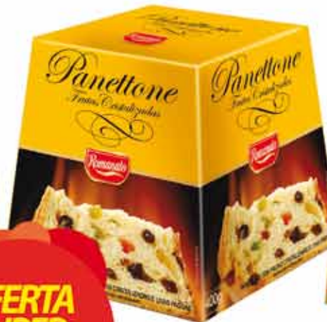
Panettone Romanato Frutas/ Gotas Chocolate 400g