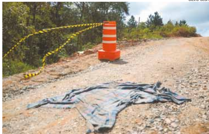
'Pacotinho' - Ação recorrente em 2014, embrulho voltou a ser realizado

A Polícia só identificou o corpo e o sexo da vítima, após uma criança afirmar que o seu pai estava perdido há alguns dias e informar que ele tinha uma tatuagem nas costas com os dizeres "Nega Te Amo". O