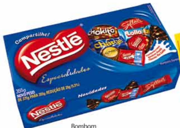
Bombom Especialidades Nestlé 355g