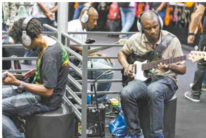
Música - Visitantes podem experimentar instrumentos nos estandes