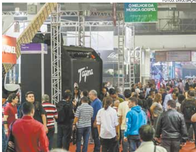
Som alto - Edição do ano passado reuniu bom público no local

No palco Music Hall, 18 apresentações serão feitas, com duração de 45 minutos cada.