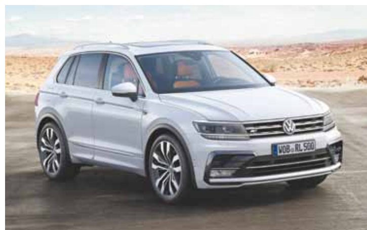
Tiguan R-Line - Clássico modelo on-road preparado para uso off-road