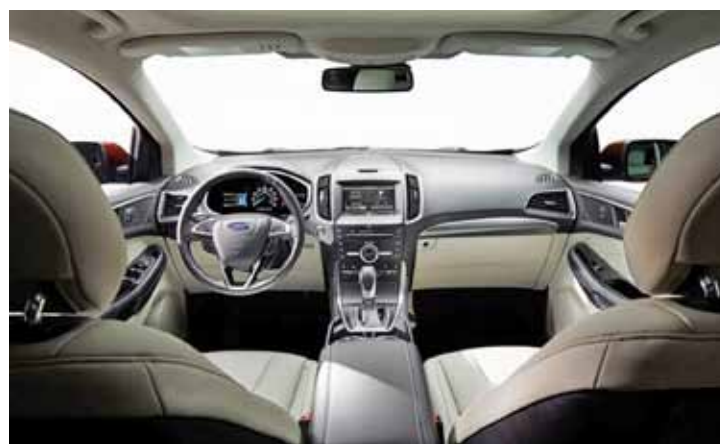
Motor - Diesel TDCi 2.0 de 190 cv com transmissão de 6 velocidades

Veículo foi projetado para receber a classificação cinco estrelas de segurança do Euro NCAP