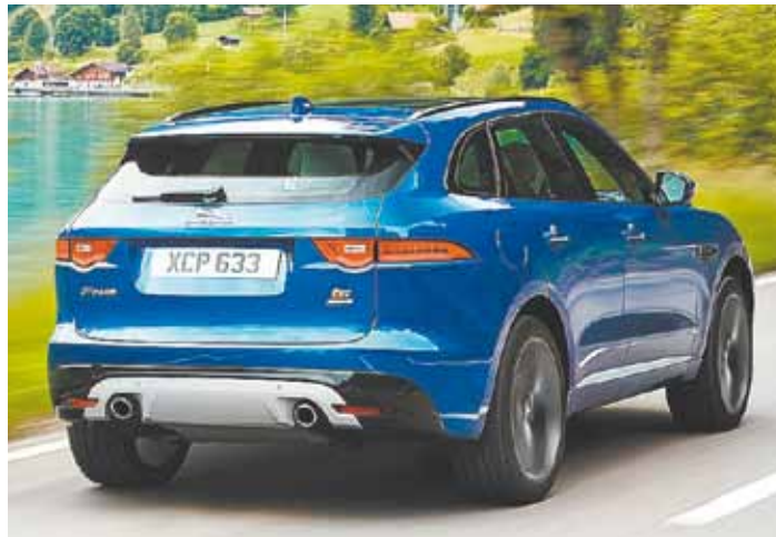
Eficiência - 80% de sua estrutura em alumínio para total agilidade