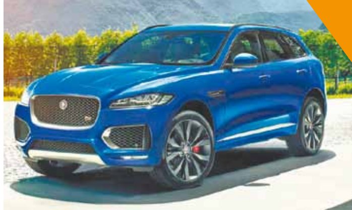
Pioneiro - Primeiro crossover produzido em toda a história da marca