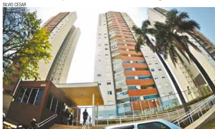
Outro dia - Prédios da Vila Augusta sofreram com reflexo do terremoto

A Defesa Civil disse que registrou 30 ligações dos bairros de Vila Augusta, Cocaia e Centro. Não houve pessoas feridas.