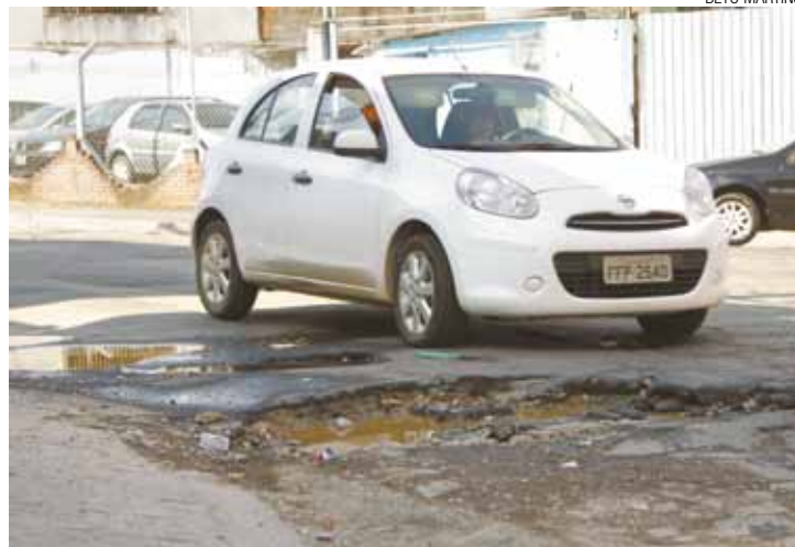
Risco - Buraco faz com que motoristas desviem à pista no sentido contrário