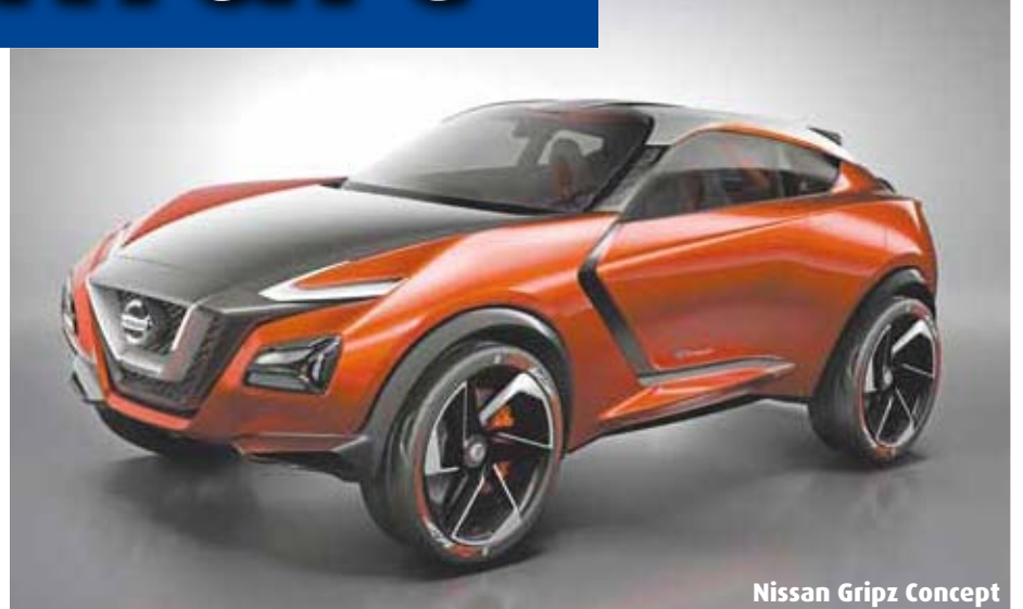
Nissan Gripz Concept