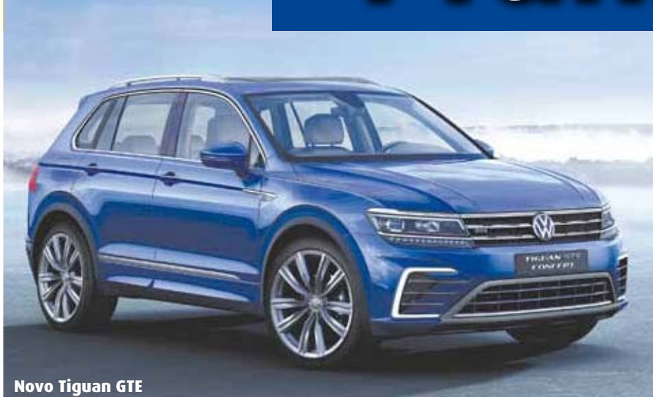
Novo Tiguan GTE