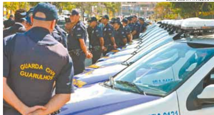
Expostos - Profissionais também reclamam da falta de fardas