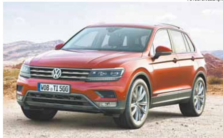
Tiguan - Utilitário esportivo ganha novo design e novas tecnologias

Os sistemas de assistência aperfeiçoam a conveniência, dinamismo e segurança do veículo. O novo Tiguan é equipado, de série, com Front Assist, com Frenagem Urbana de Emergência e Monitoração de Pedestres; o Lane Assist (assistente de mudança de faixa) e o sistema de Frenagem Automática Pós-colisão. Os serviços online disponibilizados abrem novas dimensões.