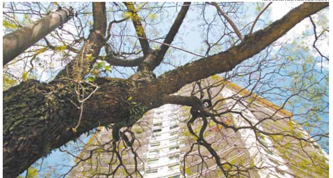
Natureza - Prenúncio de primavera, ramos de folhas verdes começam a brotar nos galhos secos das árvores