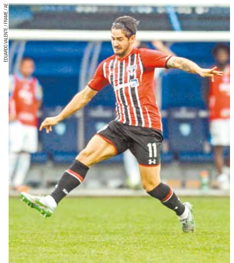
Pouco inspirado - Pato começou no banco, entrou, mas não resolveu

GOLS - Marquinhos, aos 17, e Breno, aos 42 minutos do primeiro tempo; Anderson Lopes, aos 26 do segundo. ÁRBITRO - Jailson Macedo de Freitas (BA). CARTÕES AMARELOS - Auro, Renan Ribeiro, Everton Silva e Rogério. RENDIA - R$ 214.830,00. PÚBLICO - 9.579 pagantes. LOCAL - Estádio da Ressacada, em Florianópolis (SC).