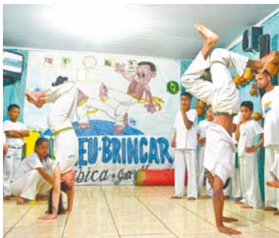
Quase uma dança - Capoeira tem muita plasticidade