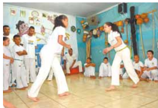
Pra mulheres - Esporte também é feminino