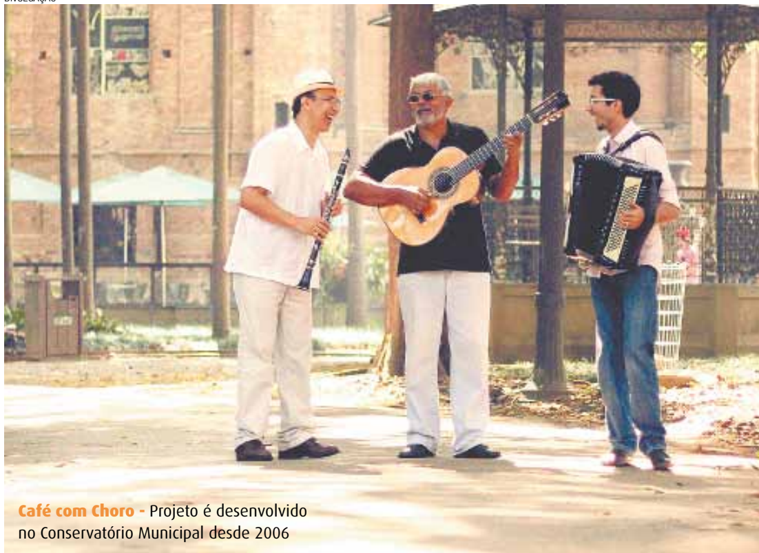
Café com Choro - Projeto é desenvolvido no Conservatório Municipal desde 2006