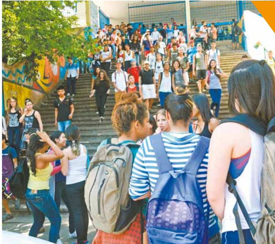
Novidade - Escolas do Estado atenderão alunos de grupo específico a partir do ano que vem