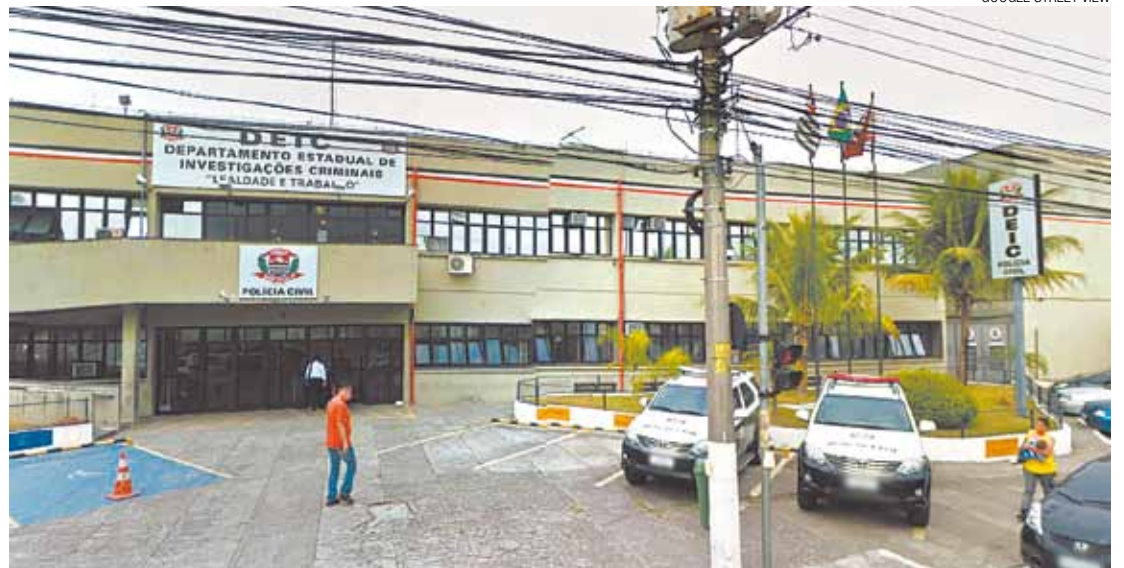
Na Capital - Detido em Guarulhos foi levado ao Departamento Estadual de Investigações Criminais (Deic)

Além de pertencer a uma facção, preso participaria de quadrilha de furto de veículos