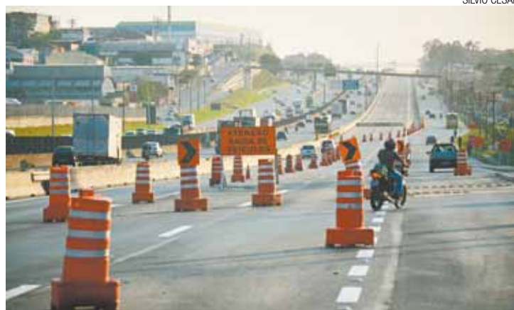
Opção - Novo trecho da pista marginal deve aliviar trânsito na região

Rodovia recebe cerca de 180 mil veículos por dia