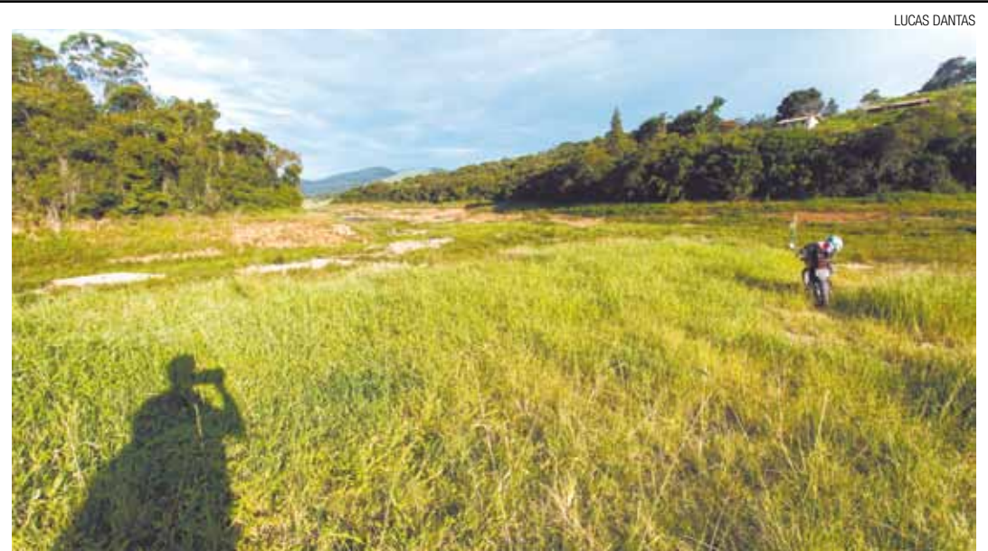
Seca - Na cidade vizinha de Nazaré Paulista, mato toma conta de local que já esteve cheio de água