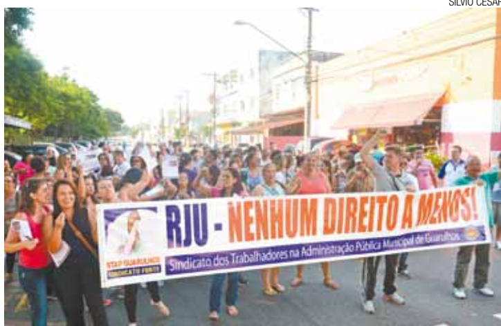
Protesto - Servidores se reuniram novamente ontem contra o RJU

A medida tem como objetivo migrar todos os funcionários celetistas para o regime estatutário, mas os servidores alegam que vão perder parte dos benefícios adquiridos com o tempo.