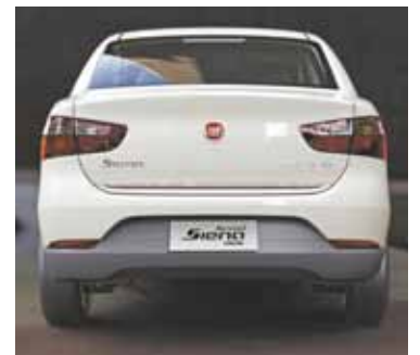
Siena EL - Novo interior, spoiler traseiro e sensor de estacionamento