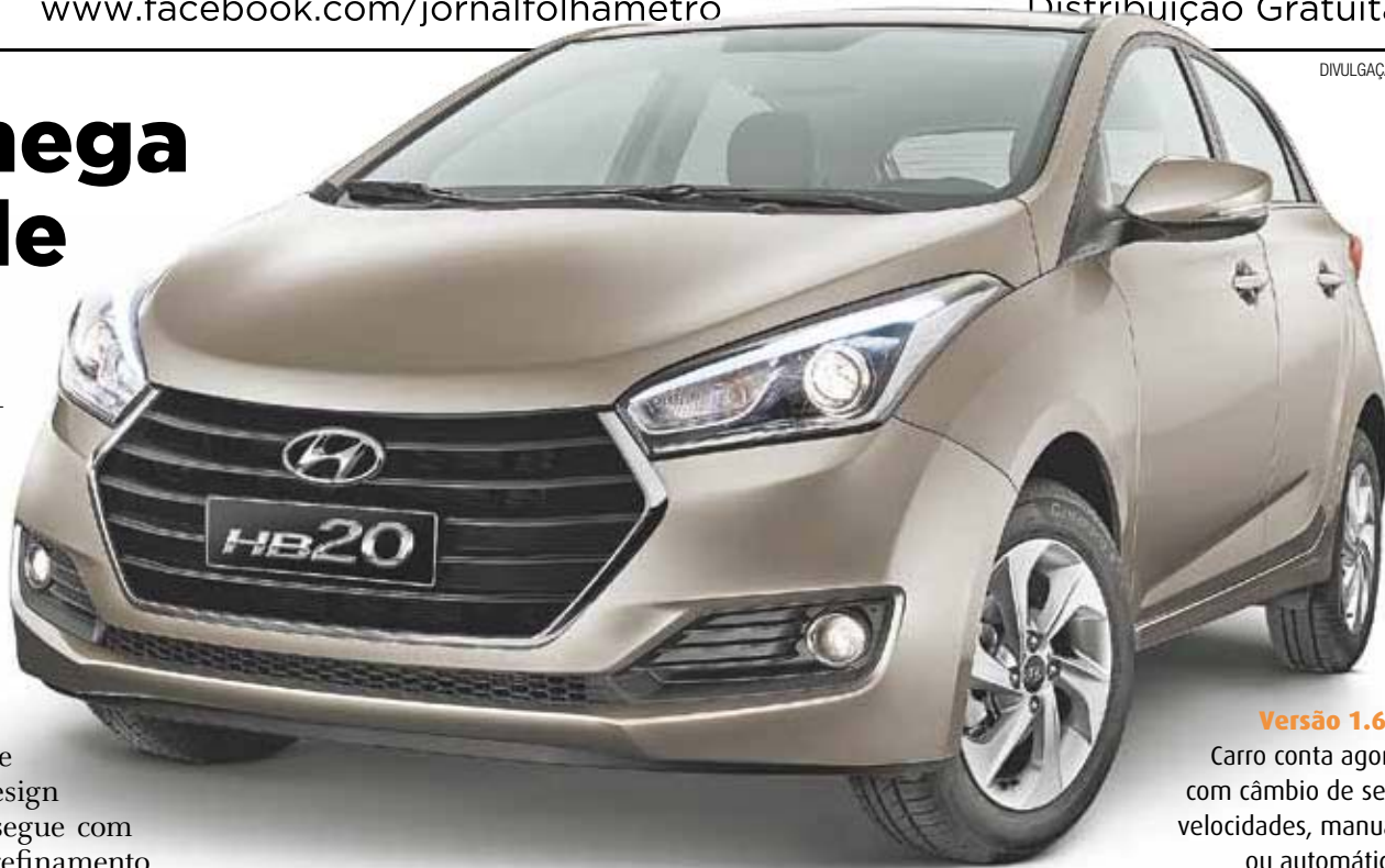
Versão 1.6 -

Para a reestilização, o visual foi totalmente atualizado seguindo a evolução da filosofia de design da Hyundai - Escultura Fluida 2.0 -, que prossegue com inspiração na natureza, acrescentando maior refinamento nas formas e acabamentos. O conceito foi responsável por transformar a Hyundai, a partir de sua versão 1.0 lançada em 2009, em referência em design automotivo, ajudando a marca a criar uma linguagem familiar e uma conexão emocional entre os clientes e seus veículos.