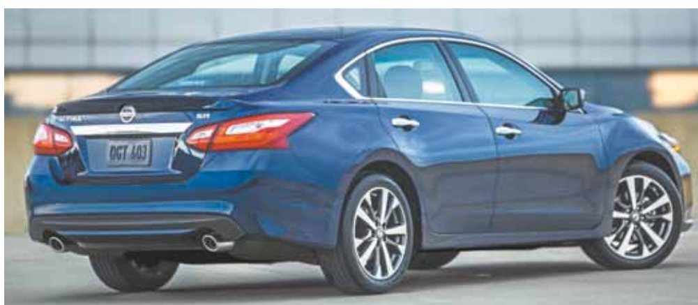
Altima - Modelo da Nissan mais vendido na América do Norte passou por mudanças no design