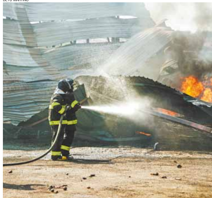
Incêndio - Bombeiros combatem chamas em depósito do Ceag Pág. 6