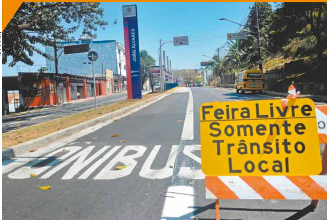
Adeus - Feirantes venderam na Rua Quitandinha pela última vez ontem; corredor de ônibus pede passagem