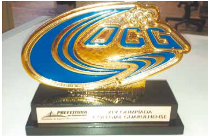
Troféu - Abertura oficial da OCG acontece no domingo, no Bosque Maia

as leis trabalhistas durante o tempo fora da escola.