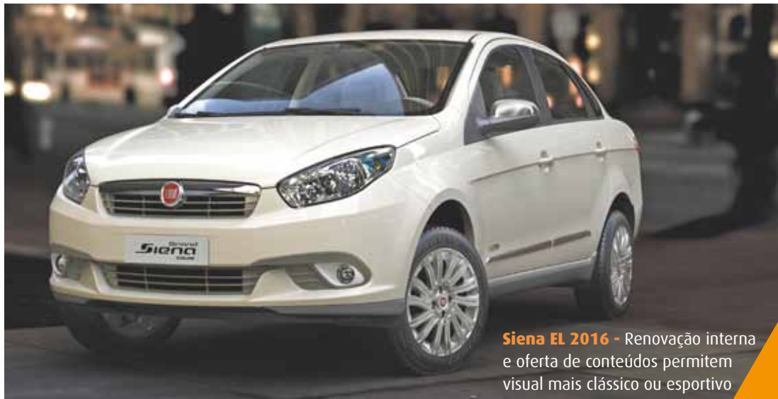
Siena EL 2016 - Renovação interna e oferta de conteúdos permitem visual mais clássico ou esportivo

Preços da linha 2016: Siena EL 1.0 Flex – R$ 35.770 e Siena EL 1.4 Flex – R$ 38.500.