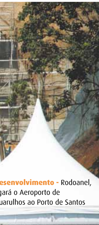
Desenvolvimento - Rodoanel, ligação do Aeroporto de Guarulhos ao Porto de Santos