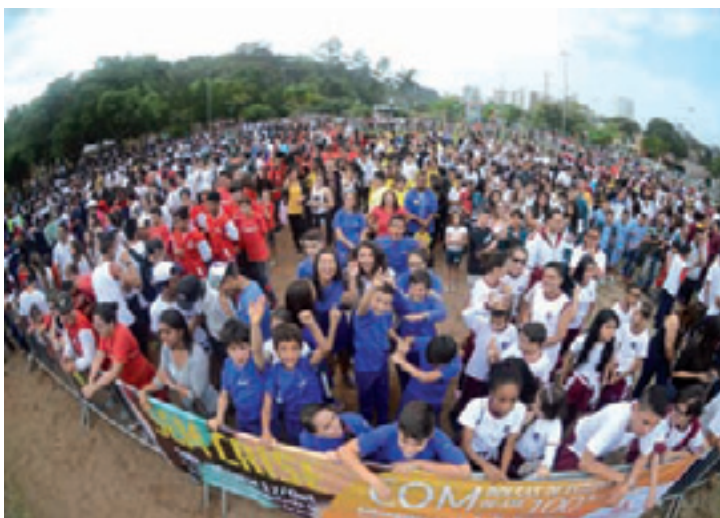
Só festa - Garotada curtiu abertura da OCG mesmo sem show