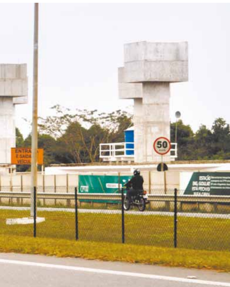
até a Capital. Trajeto deve desafogar trânsito na Rodovia Presidente Dutra