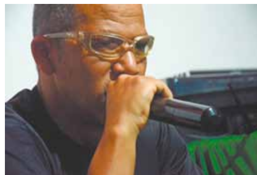
Rap - Intenção do grupo é levar poesia aos jovens