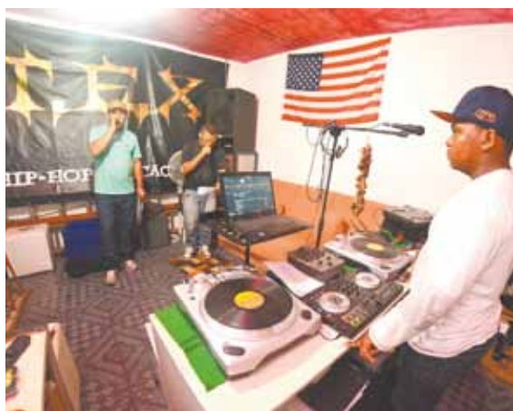
Sarau - Grupo vai participar de reunião de poesia

O grupo também já se apresentou na Vira Sustentável e na Fundação Casa.