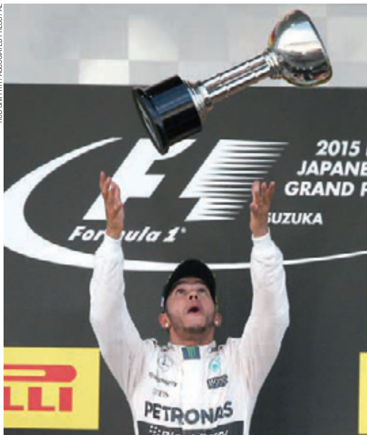
Realidade - Fã de Senna, Hamilton alcança número de troféus do ídolo

A próxima etapa será realizada no circuito de Sochi, que sediará o GP da Rússia no dia 11 de outubro.