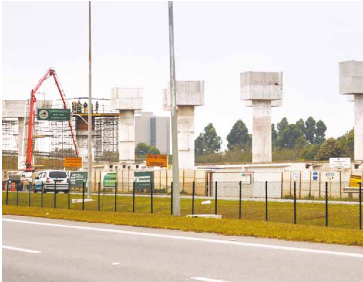
Sonho próximo - Linhas 13-jade da CPTM, que está com as obras em andamento, vai permitir deslocamento ferroviário