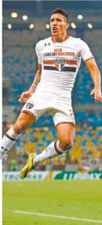
Gringo - Centurión vibra com gol da classificação do São Paulo