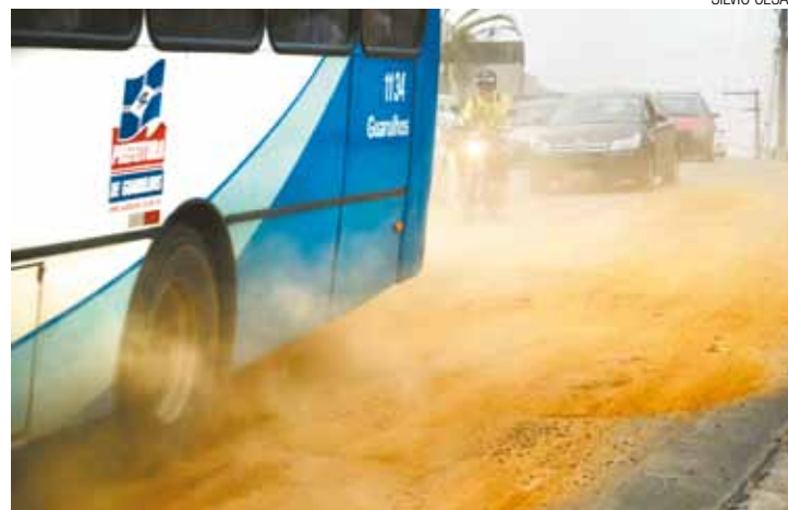
Muita terra - Via ainda tem um buraco de quase 30m de comprimento

Bandeirante diz que vai fazer vistoria nos postes de luz