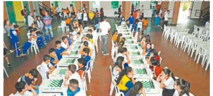
Competição - Modalidades xadrez e damas serão encerradas hoje