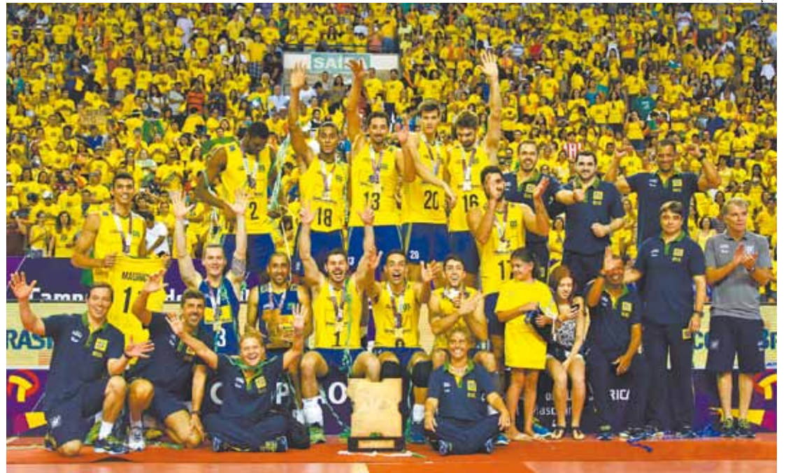
Comigo ninguém pode - Jogadores da Seleção comemoram 30º título Sul-Americano. Venceu todos que jogou

A Argentina até assustou no começo, mas logo a Seleção Brasileira acordou e virou a partida. Lucão não encontrava resistência no bloqueio adversário e, auxiliado por boas jogadas de Lucarelli e Lucas Lóh, comandou a reação.