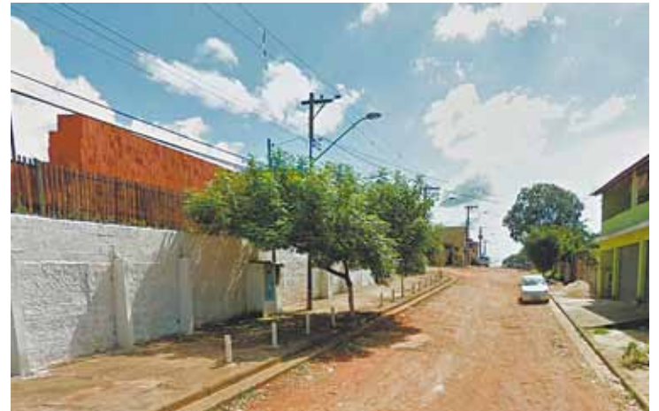
Terra - Rua Conceição da Pedra, no Bonsucesso, é uma das vias sem asfalto

Inquérito foi aberto por denúncia de aposentado