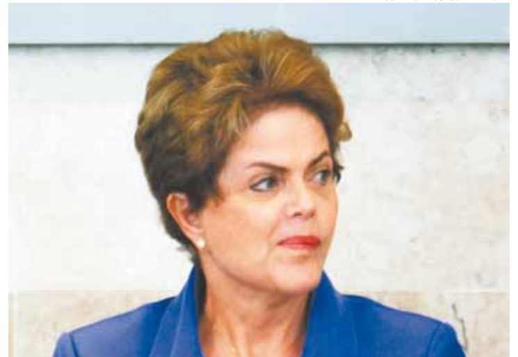
Complicado - Contas de Dilma, agora, serão apreciadas pelo Congresso

O outro ponto, questionado pelo Ministério Público, tratou de cinco decretos envolvendo créditos suplementares assinados pela presidente Dilma Rousseff, sem autorização do Congresso Nacional.