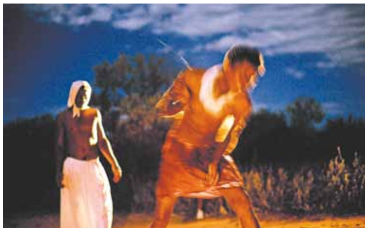
Calvário - A série "Penitentes" descreve o ritual da Sexta-feira Santa