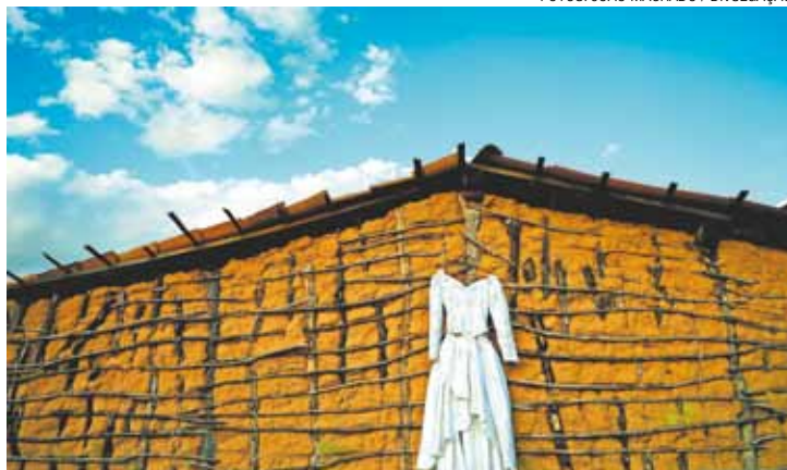
Intrigante - Mostra traz 20 imagens que retratam os costumes locais

João fotografa o nordeste desde 2002, quando começou a documentar Bom Jesus da Lapa e sua tradicional Ro-