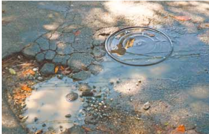
Mau cheiro - Moradores reclamam há 30 dias; Saae diz que consertou

tário de um comércio localizado na Rua Manoel Augusto Gomes, o Saae passa por cima do vazamento mas não arruma. "O pessoal do Saae passa aqui direto e não arruma. Só desentupiu. Isto tem uns 15 dias, mas o vazamento voltou a ocorrer."