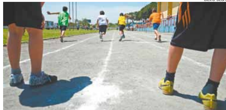
Disparada - Finais de ontem foram disputadas na Ponte Grande

Todos os resultados do atletismo podem ser conferidos em guarulhos.sp.gov.br/ocg. Hoje haverá as finais do handebol, futsal, e o encerramento oficial.