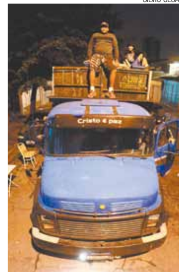
Confusão - Feirantes foram impedidos na semana passada

Na última quinta-feira, 1º, por conta da inauguração do Corredor Metropolitano, os feirantes tentaram armar as barracas na Rua Cristóvão Colombo, como propôs a Secretaria de Desenvolvimento Urbano, mas foram impedidos pelos moradores. Ontem, o comércio não funcionou.