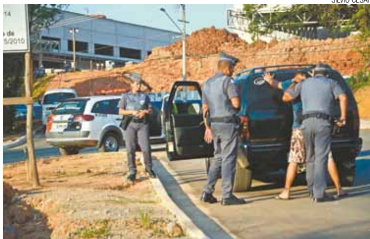
Bloqueios - Policiais revistam homem na região de Bonsucesso

Até o final desta edição a operação contabilizou dois criminosos recapturados, 87