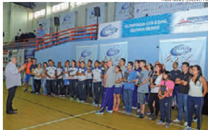
Premiação - Primeiros colocados receberam medalhas e troféus