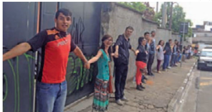
Abraço - Representantes de movimentos estudantis também foram ao ato