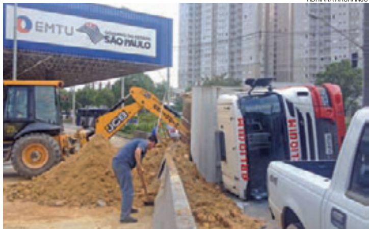
Susto - Carregamento de areia ficou espalhado pela Tancredo Neves