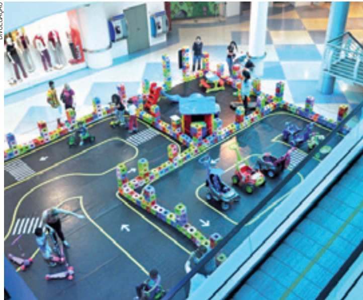
Diversão - Internacional oferece teste drive de triciclos, carros e patinetes

No Internacional Shopping crianças de um a oito anos poderão testar gratuitamente triciclos, carros com haste e patinetes em uma pista de 100m 2 . O "teste drive" começa às 14h e