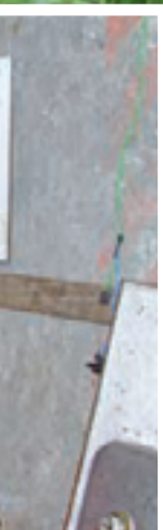
Marcas - No barraco havia inscrição numérica que remete ao nome da facção criminosa PCC