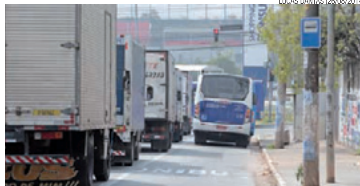
Liberado - Faixa de ônibus na Av. Eduardo Froner é uma das contempladas

O horário de permissão é das 6h às 20h, exceto para a Delfinópolis, que funciona em