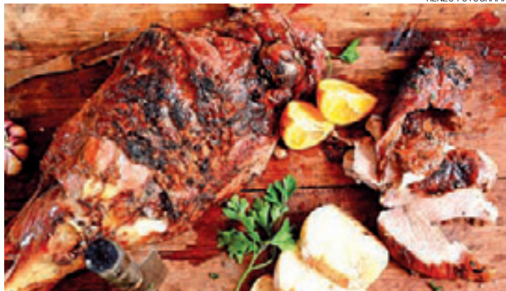
Iguaria - Assados ganham sabor especial por serem feitos na lenha